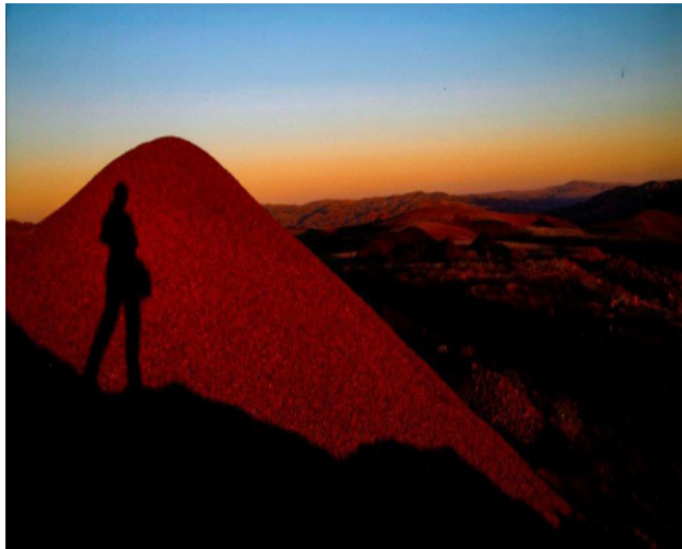
Kapak Fotoğrafi: Kamile Kurt'un "Krom Madeninde Gün Batımı" adlı eseri. TTBB-Sted 2018 Fotoğraf yarışması arşivinden