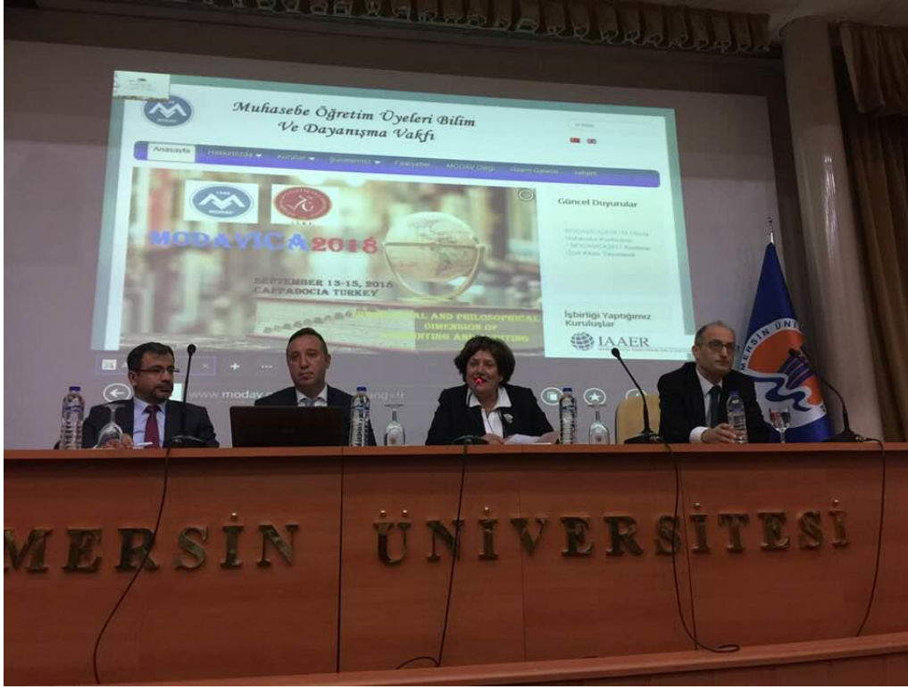
MÖDAVICA 2018, Mersin Üniversitesi, Kapadokya-Neşehir, 13-15 Eylül 2018.