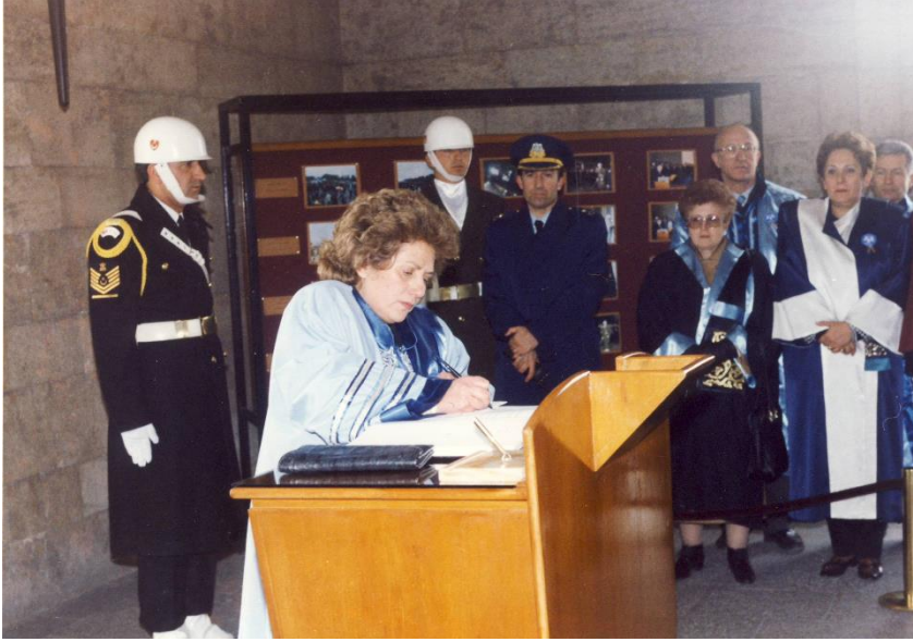
Muhasebe Öğretim Üyeleri Bilim Dayanışma Vakfı (MÖDAV) Başkanı olarak vakıf kuruluşunda Anıtkabir ziyaretimiz. Ankara, 1995.

Ayrıca kongre hazırlıkları esnasında meslek odaları maalesef yeterli desteği sunmadı. Hem durumları bugünkü kadar iyi değildi hem de biz tarafsızdık. Başka sponsorlar bularak yurt dışından gelen misafirlerin bütün maliyetine katlandık. Hatta duruşumuza itiraz eden meslek mensuplarının da Sheraton Otel’de bir kuruş harcamadan konaklamalarını sağladık. 15. Muhasebe Kongresinin açılışına bakanlar da geldi. Kamil Büyükmirza Hoca’nın da başkan olarak katkıları vardı kuşkusuz. Fakat günün sonunda o sorumluluğu tek başımıza üstlenip götürdük ve TÜRMOB bütçesinden bir kuruş katkı alamadık. Tabii bunları pek dile getirmiyoruz zira gerek yok. Çünkü kuruluş dönemi idi ve geçmişte kaldı. Şimdi böyle etkinlikleri TÜRMOB gayet güzel yapıyor.