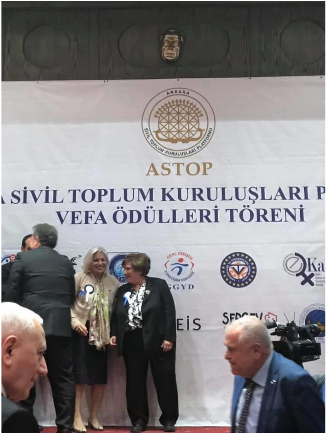
Ankara Sivil Toplum Kuruluşları Platformu- ASTOP Vefa Ödülü Töreni, Ankara, 5 Nisan 2019.