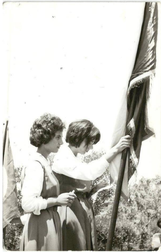
Sancak devir alırken, Lefke Ticaret Lisesi, Kıbrıs, 1965-66.

muhasibeyi sevmişim diyorum. Gerçekten de ortaokulu bitirdiğimde hocalarım ‘ Senin matematiğin iyi. ’ dese de başka liseye gitme imkânım yoktu. Bir ara Birleşmiş Milletler yetkilileri gelerek ‘ Sizleri tankların içinde gizleyerek Lefkoşa’daki liseye götüreceğiz. ’ dediler. Böylece anneme giderek liseyi orada okuyacaktım. Lefkoşa’ya gidebilmek için Rum bölgelerini geçmek gerekiyordu. Fakat son anda Birleşmiş Milletler görevlileri vazgeçtiler yani güvence veremediler. Dolayısıyla Lefke’deki Ticaret lisesine kayıt oldum ve ticaret lisesinden mezun oldum. Genelde çalışkandım yani okul birincisiydim. Hatta o tarihlerde kuraldı; son sınıfa dereceyle geçen erkek öğrenciler bayrağı, kızlar ise sancağı taşırdı. 19 Mayıs, 23 Nisan, 29 Ekim gibi resmi etkinliklerde sancağı taşıyarak tören yerine kadar giderdik. O tarihlerde çok zayıf olduğum için sancağı düşürme endişesiyle dua ederdim ki yağmur yağmasın, rüzgar çıkmassın. Bu güzel heyecanları hâlâ unutamam.