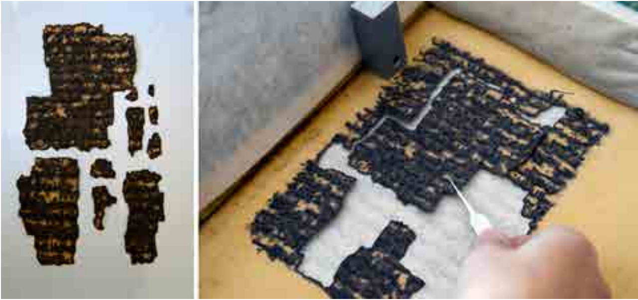
Görsel 3 Mürekkep korozyonlu bir eserde konservasyon uygulaması

yapılmaktadır. Bu nedenle, her aşamada konservatör kendisine, o uygulamayı neden yaptığını sormakta ve yaptığı işin gerekliliğini rapor olarak kaydetmektedir.