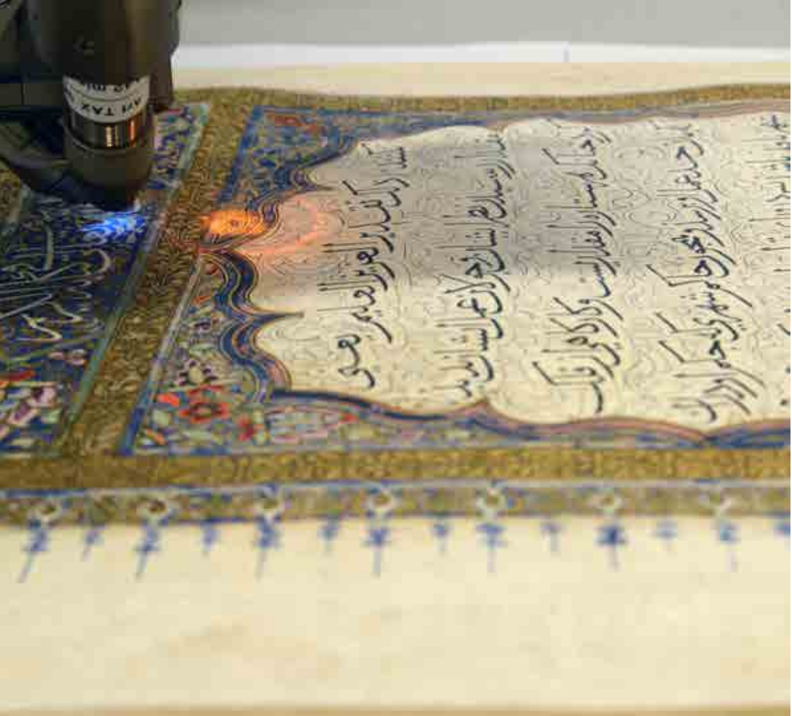
Görsel 1 Yazma eser üretiminde kullanılmış boyar maddelerin tespitinde XRF analizi

metli olduğu fark edilmiştir. Şifahanede de bilimin ışığında ve sanatın inceliği ile yürütülen çalışmalarda eserlere ait tüm özellikler belgeleme formu aracılığıyla kayıt altına alınmaktadır. Eserlerin kuruma gelişinden işlemlerinin bitimine kadar süregelen bütün aşamalar fotoğraflanmaktadır. Belgeleme, tıpkı kitap arkeolojisi yapar gibi kodikolojik bir yaklaşım ile gerçekleştirilmektedir.