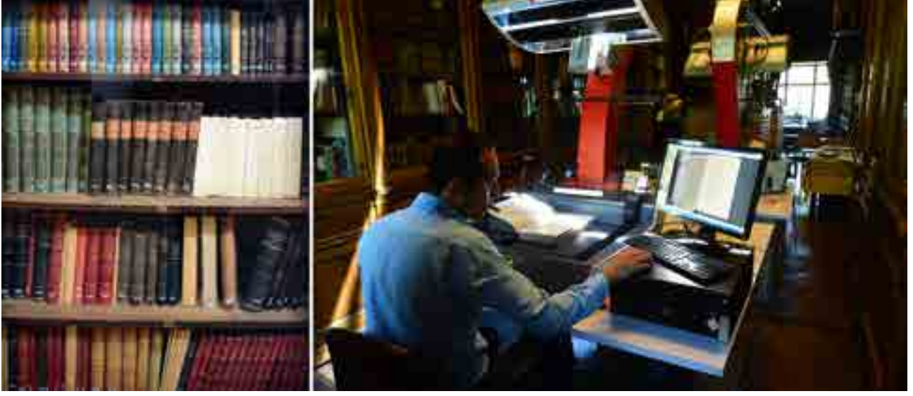
Görsel 6 İstanbul Arkeoloji Müzeleri Müdürlüğünde dijitalleştirme çalışmaları