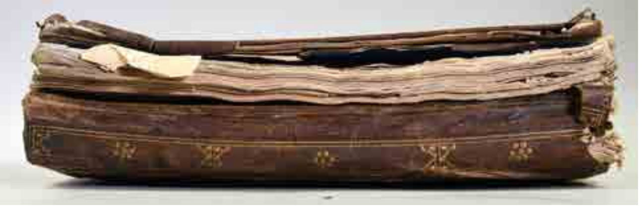
Görsel 4a ve 4b. Beyazıd Yazma Eser Kütüphanesi'nden bir yazma eserin cildindeki deformasyon, konservasyon öncesi ve sonrası.