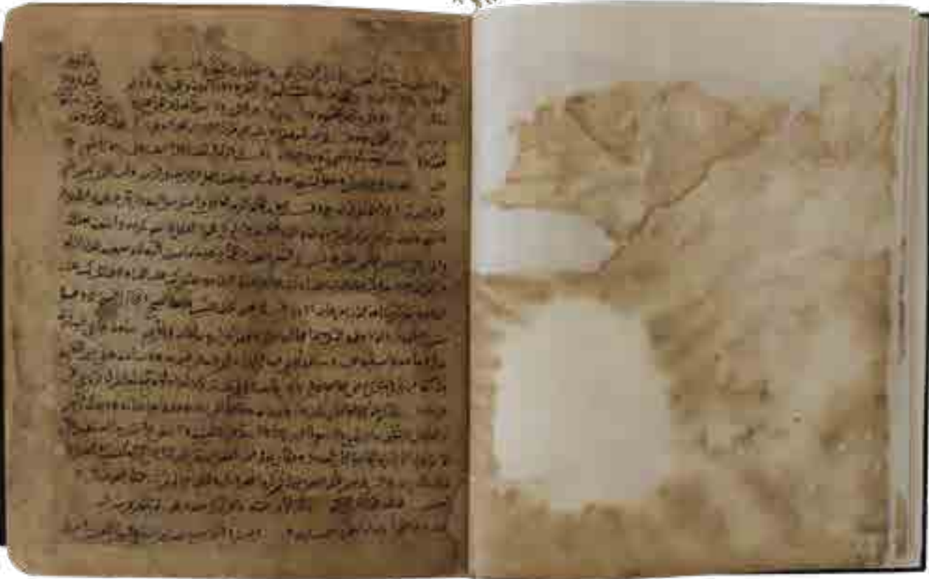
Görsel 5a ve 5b Süleymaniye Yazma Eser Kütüphanesinden bir yazma eserin metin kısmının konservasyon öncesi ve sonrası.