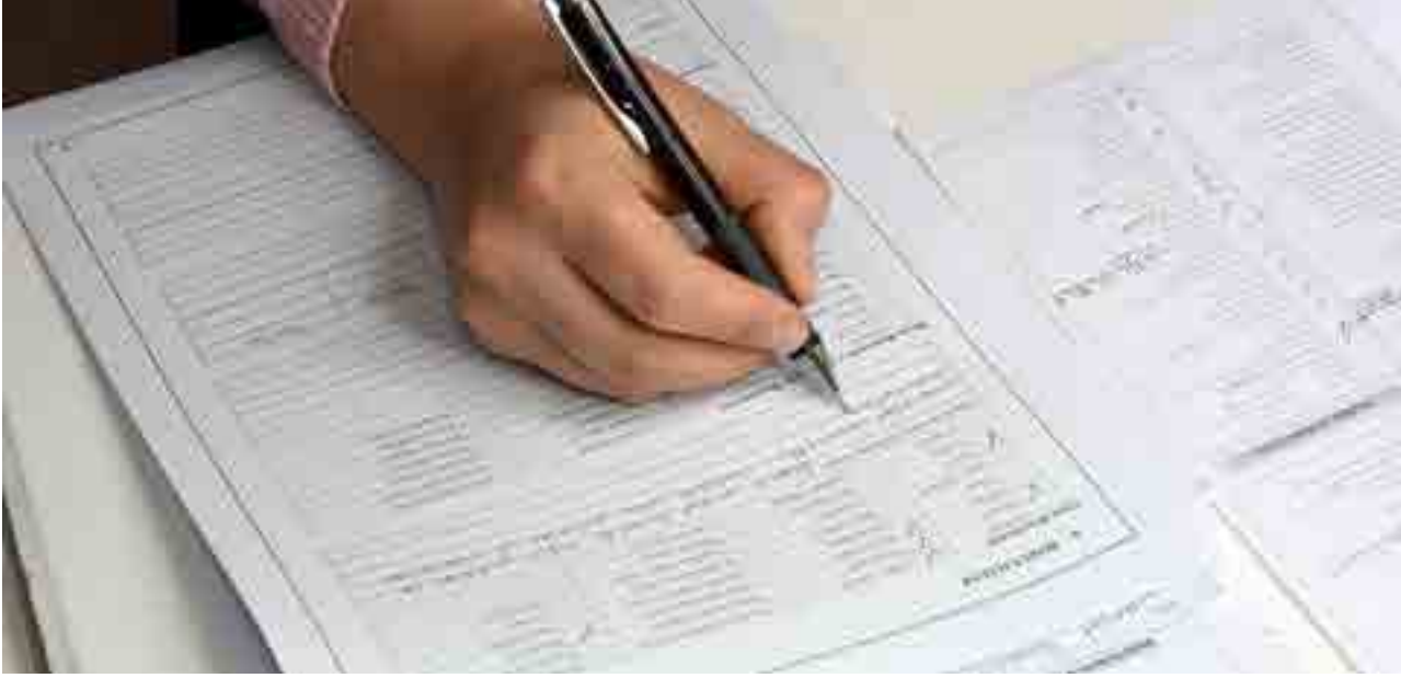
Görsel 2 Kitap Şifahanesi'nde eserlere yönelik belgeleme çalışmaları