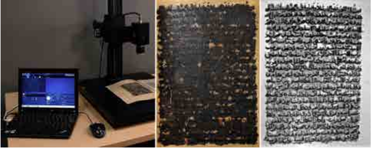
Görsel 7 Reflektografi sistemi ile mürekkep korozyonlu bir eserde görüntü netleştirme