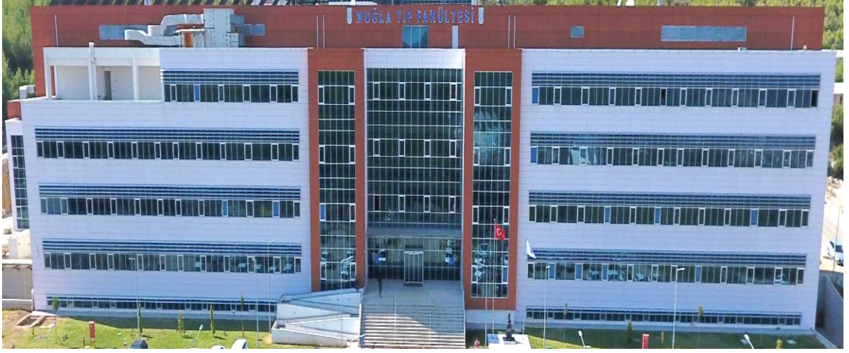
Muğla Sıtkı Koçman Üniversitesi Tıp Fakültesi