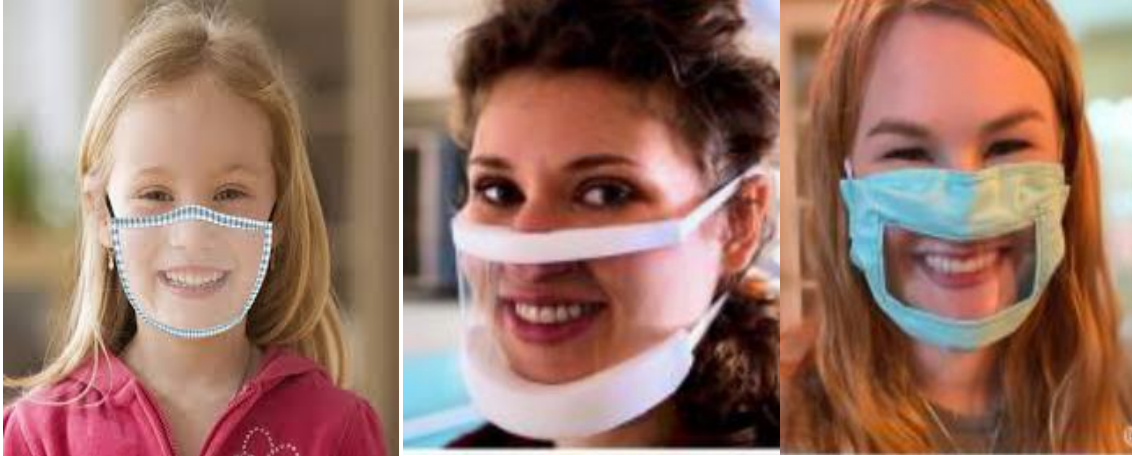
Figure 1. Examples of transparent masks (Remacle & Bernardoni, 2021)

- Maryn et al., on the other hand, recommend using face masks be suitable for education, and wearing surgical masks in environments where verbal communication is priority and physical distance is respected (Maryn, Wuyts, & Zarowski, 2021). Below are some examples of transparent masks.