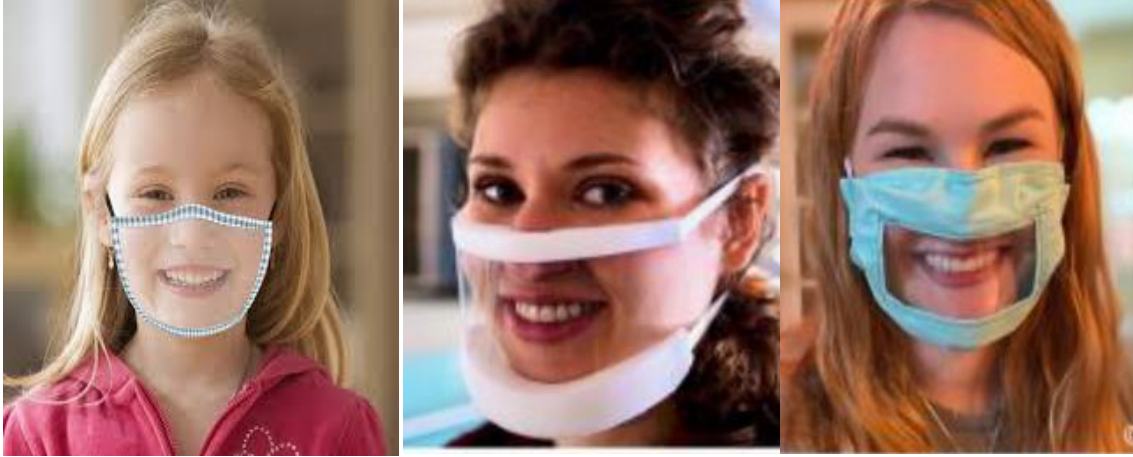
Şekil 1. Şeffaf maske örnekleri (Remacle & Bernardoni, 2021)