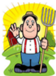
Ali Amcanın Arazisi

Bu konuda onlara yardımcı olman gerekmektedir. NOT: Parsellerin alanlarının, alan ve arazi ölçü birimleri arasındaki dönüşümlerini yaparak, birbirine çevirip bütün alanları aynı birimle gösterebilirsiniz. Böylece alanların birbirine eşit olup olmadığını görebilirsiniz.