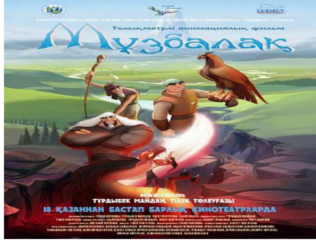
Resim 1. Muzbalaq çizgi filminin tanıtım panosu

https://kazakhfilmstudios.kz/kaz/movies/9505/