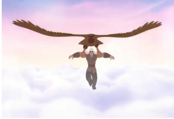
Resim 2. Muzbalaq adlı kartal ve Aktay adlı delikanlının dostluğunun sergilenmesi

https://kazakhfilmstudios.kz/kaz/movies/9505/