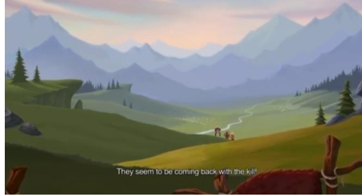
Resim 4. Yayla manzarası

https://kazakhfilmstudios.kz/kaz/movies/9505/