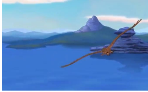
Resim 3. Burabay Gölü

https://kazakhfilmstudios.kz/kaz/movies/9505/