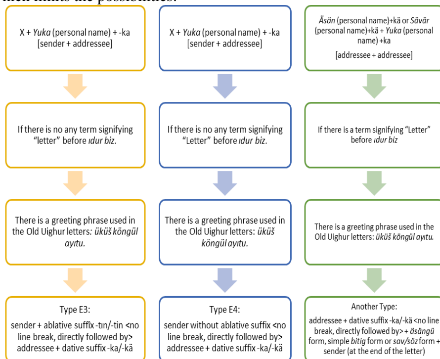
Figure 1. The assumptions on the epistolary formula of the document U 5933

formula of this letter according to Moriyasu's classification [1, p. 11-13], which limits the possibilities: