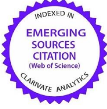
Emerging Sources Citation Index (2017'den beri)