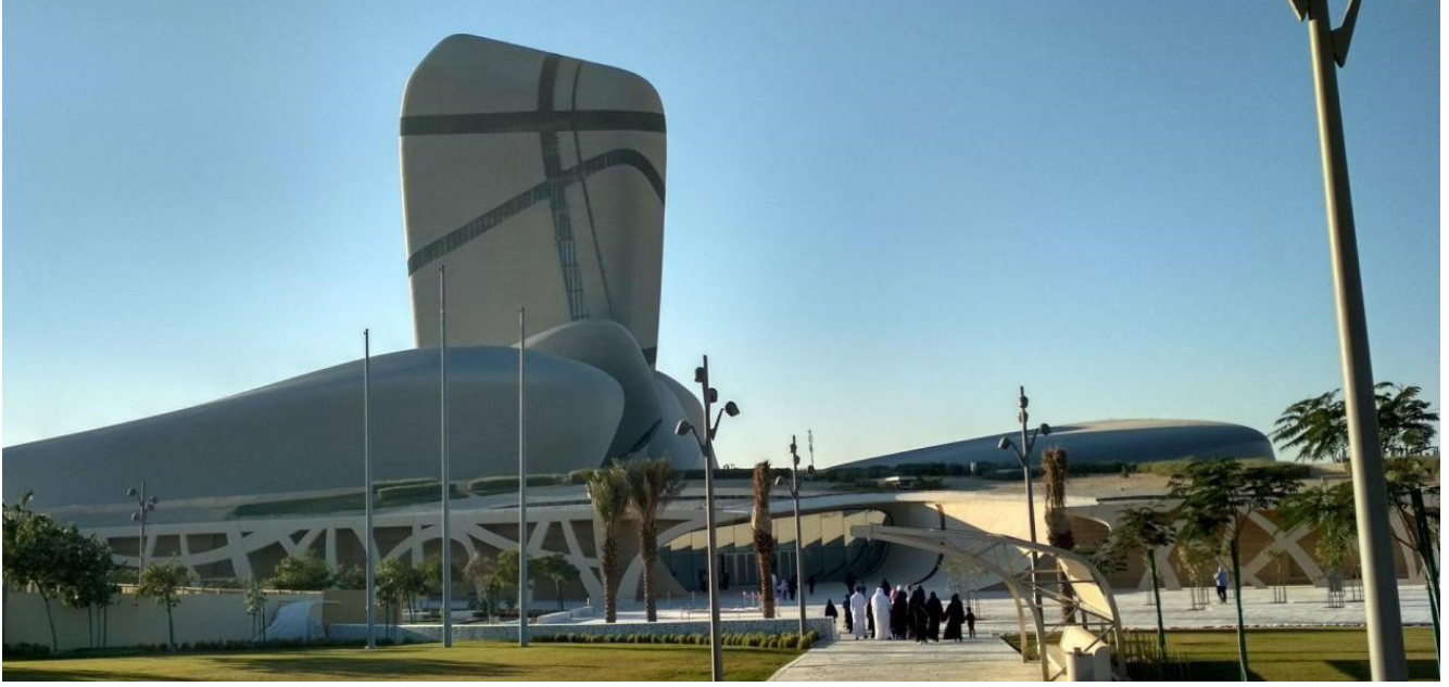
Figür 2: Kral Abdülaziz Dünya Kültürü Merkezi Dış Görünüş

ve etkinliklere ev sahipliği yapmaktadır. Büyük Salon'da 29. Arap Zirvesi gibi uluslararası sanat sergileri ve 17. Arap Düşünce Forumu ve Uluslararası Petrol Teknolojisi Konferansı gibi önemli etkinlikler gerçekleştirilmiştir ( https://www.ithra.com/en/ ).