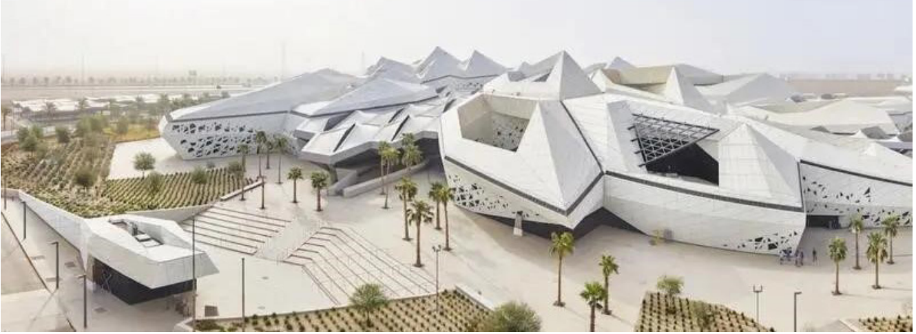
Figür 9: Petrol Müzesi Tasarım Projesi.

( https://www.albawaba.com/editors-choice/its-first-black-gold-museum-and-will-be-launched-riyadh-1379814 , Erişim Tarihi: 11.11.2022)