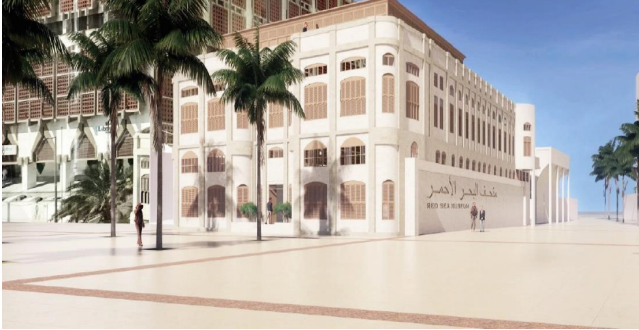
Figür 6: Kızıldeniz Müzesi Tasarım Projesi ( https://www.constructionweekonline.com/cloud/2021/07/06/redseamuseumegissaudiarabia_1.png , Erişim Tarihi 11.11.2022)

culuğunda insan uyumu ve kültürel zenginliğin hikayesini anlatırken tüm gelenekleriyle farklı milletler arasındaki etkileşimi de gözler önüne sermeyi hedeflemektedir ( https://saudigazette.com.sa/article/598235 ).