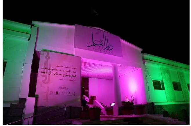
Figür 5: Dar-ül Kalem Merkezi ( https://www.arabnews.com/sites/default/files/userimages/2433041/img_3575.jpg , Erişim Tarihi: 11.11.2022)

Suudi Arabistan Kültür Bakanlığı 2020'yi Arap Hat Yılı ilan etmiş ve Medine merkezli Dar-ül Kalem Kompleksi, Arap hat sanatında yeterlilik sertifikaları veren uluslararası bir enstitü olma planlarını açıklamıştır. Velihaht Prens Muhammed bin Selam tarafından desteklenen merkezin geliştirilerek alanında öncü bir kurum haline getirilmesi planlanmaktadır ( https://saudigazette.com.sa/article/592406/SAUDI-ARABIA/Dar-Al-Qalam-calligraphycenternamed-after-Crown-Prince ).