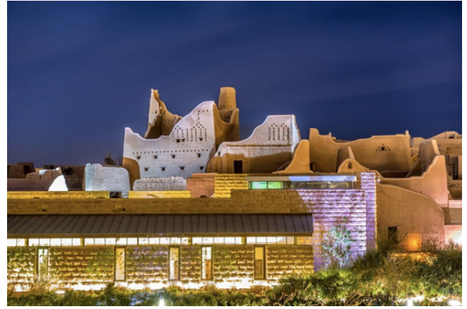
Figür 8: Suudi Modern Sanat Müzesi’nin kurulması planlanan Diriye’den bir görünüm ( https://www.abouther.com/node/23686/people/features/saudi-arabia-plans-launch-its-museum-modernarthistoric-town-diriyah , Erişim Tarihi: 11.11.2022)

Diriye Kapısı Geliştirme Kurumu (DGDA) ve Suudi Kültür Bakanlığı, geleneksel kerpiç mimarisiyle ünlü Diriye şehrini bir kültür, eğlence ve turizm merkezi olarak geliştirmenin bir parçası olarak şehrin Bujairi semtinde Suudi Modern Sanat Müzesi kurmayı kararlaştırmıştır. Suudi Kültür Bakanlığı, geleneksel yerel mimari tarzından ilhamla modern bir konseptte tasarlanacak müze projesinin hayata geçirilmesi için Diriye Kapısı Geliştirme Kurumu (DGDA) ile bir işbirliği anlaşması imzalamıştır. Müze projesi ile Suudi çağdaş sanat eserlerini tanıtıcı ve teşvik edici bir platform haline getirmek amaçlanmaktadır. Müze koleksiyonunda yer alacak eserler ve yapının mimarı hakkında bilgi verilmezken müzenin ne zaman açılacağı henüz açıklanmamıştır ( https://www.thenationalnews.com/arts-culture/art/saudi-museum-of-modern-art-to-open-inaddiriyah-1.927506 ).