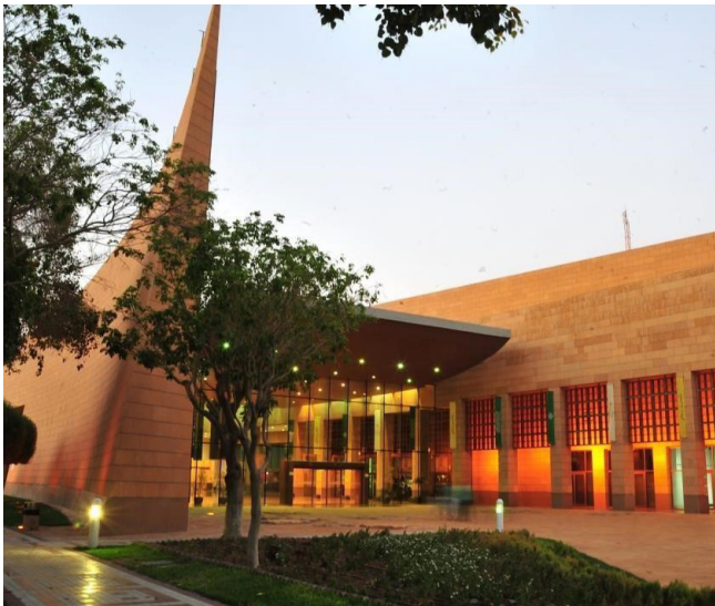
Figür 1: Suudi Arabistan Ulusal Müzesi Dış Görünüm ( https://www.visitsaudi.com/en/see/highlights/the-national-museum-of-saudi-arabia , Erişim Tarihi: 11.11.2022)

Müzedde çok sayıda replika ve gerçek boyutta dioramik görüntülerle eğitici bir sergileme yapıldığı söylenebilir ( https://www.rcrc.gov.sa/en/projects/kahc ).