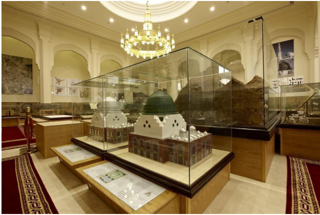
Figür 4: Darü'l-Medine Müzesi Sergileme Alanı

Sergileme, Hz. Muhammed döneminde Mescid-i Nebevî'nin ilk inşasından başlayıp İkinci Suudi Yayılımı ile biten Mescid-i Nebevî'nin tarih boyunca nasıl değiştiğini göstermektedir. Harem-i Şerif'in bir modeli de müzede sergilenen eserler arasındadır ( https://madainproject.com/dar_al_madinah_museum ).