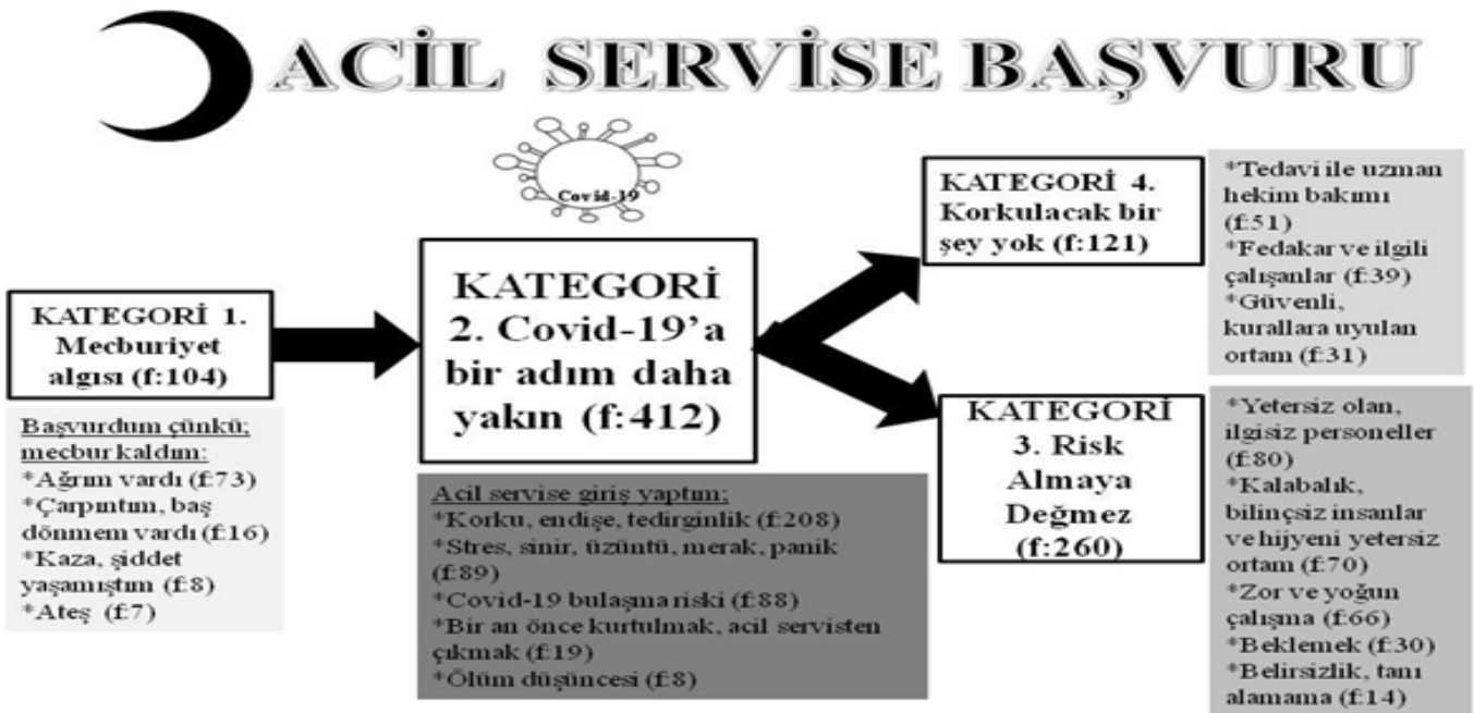
Şekil 1. Hasta ve yakınlarının gözünden COVID-19 pandemi sürecinde acil servise başvuru yapmak olgusu: "COVID-19'a bir adım daha yakın" Ulaşılan kategoriler ve frekans sayıları (n=77)

Hasta ve yakınlarının gözünden COVID-19 pandemi sürecinde acil servise başvuru yapmak olgusunu betimlemeye yönelik yürütülmüş nitel soru çözümlemesine dayalı bu araştırmada dört ana kategoriye ulaşılmıştır. Yapılan in-vivo kodlama ile Katılımcı 58'in görüşmede kullandığı "COVID -19 pandemi sürecinde acil servise başvuru; anlatılmaz yaşanır." ifadesi merkezi olgu tanımlamasında, görsel kavramsal sunumda süreci oluşturmada yol gösterici olmuştur. Ayrıca bu sürece yönelik odak kategoriyi açıklayan yapının (I) başvuru aşaması, (II) acil servis süreci ve (III) yaşam deneyimi aşamasını içeren süreci ifade eden bir yapıda olduğu belirlenmiştir. Ulaşılan kategorilerin etiketleri ve atıf sayıları Şekil 1'de gösterilmiştir. Bunlar en çok atıf alandan en aza doğru: COVID-19'a bir adım daha yakın (f:412), Risk almaya değmez (f:260), Korkulacak bir şey yok (f:121) ve Mecburiyet algısıdır (f:104). Şekil 1'de oluşturulan görsel sunumda dolgu renginin koyuluğu ve kategori etiketi yazısının punto büyüklüğü atıfın yüksekliği ile ilişkili kullanılmıştır. Kavramsal sunumda görüldüğü gibi, süreç