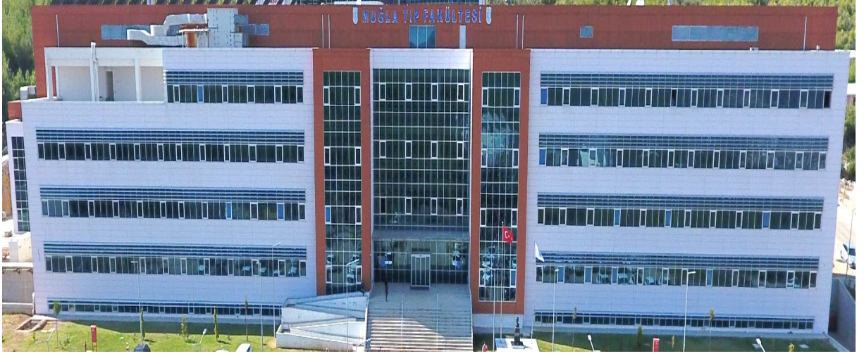
Muğla Sıtkı Koçman Üniversitesi Tıp Fakültesi