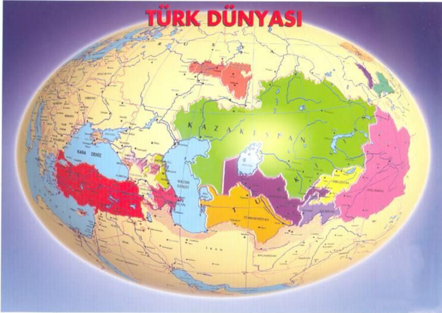
Şekil:1 Türk Dünyası haritası ( http://www.google.com.tr/search?q=türk+dünyası )

Günümüzde Dünya üzerinde bağımsız olarak varlığını sürdüren yedi adet Türk devleti bulunmaktadır. Ancak dünya üzerinde gerek özerk bölge olarak gerekse farklı ülkelerde azınlık statüsünde yaşayan pek çok Türk ve akraba topluluğu bulunmaktadır. Günümüzde Rusya, Ukrayna ve Çin başta olmak üzere Avrupa, Afrika ve diğer kıtalarda çeşitli sebeplerle yaşayan Türkler göz önüne alındığında Türklerin yedi kıtaya dağılmış olduğu görülmektedir. Bu nedenle Türk dünyası çok geniş bir alanı ifade eder. Özey'e göre Türk Dünyası, yaklaşık 20°doğu (Balkanlar) ve 90° doğu (Turfan Havzası) boylamları ile 35° kuzey ve 55° kuzey enlemleri arasında yer alır. Bu coğrafi konum, batıda Adriyatik denizinden, Doğu Türkistan'da Turan havzasına, Kuzeyden Kazan ve Sibirya düzlüklerinden Kıbrıs adasına kadar çok geniş bir dikdörtgeni oluşturur (şekil: 1)