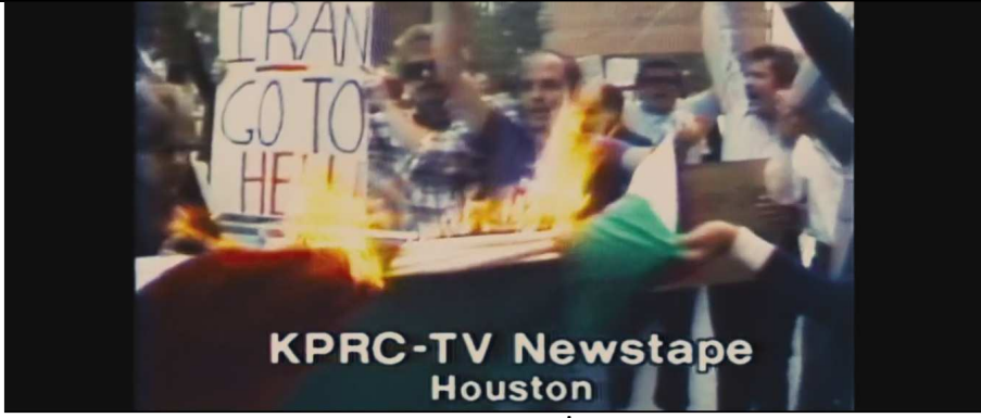
Görsel 3. Amerikalılar tarafından İran Bayrağı yakılırken.