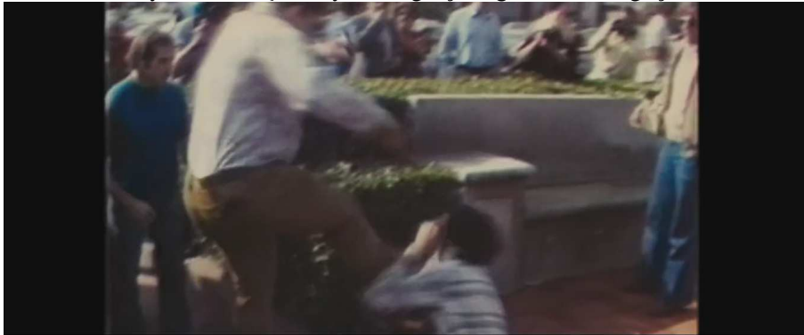
Görsel 3. Amerikalılar bir İranlı'yı linç ederken.