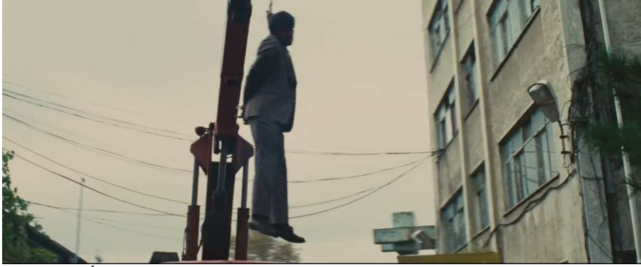
Görsel 6. İran’da insanlar sokak ortasında vinçle asılıdır, diğer insanlar buna aldırmadan günlük rutinlerine devam ederler.

Burada İran’ın karakterlerin söylemleri ve görüntüler üzerinden tanımlanmasını görüyoruz. Van Dijk (2003, s.59) tanım düzeyinin ideolojik bir söylem yapısı olduğunu belirtir. Konu seçiminden sonra, zihinsel modelin gerçekleştirilmesi için bir olay hakkında az ya da çok bilgi vererek, detaya inerek ya da inmeyerek tanımlama yapılır. Sürekli olarak, adaletin olmadığı, mahkemelerin sahte olduğu, işkencenin olduğu, önyargının olduğu, insan haklarına saygı duyulmadığı vurgusu yapılarak İran tanımlanmaktadır.