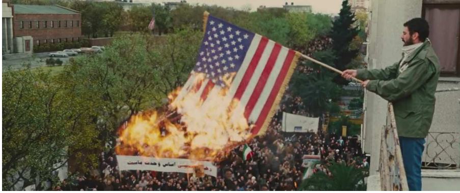
Görsel 1. Filmde Amerikan bayrağı yakılmaktadır.

Halk ABD büyükelçiliği önünde toplanır. Buradaki sahnelere ara ara gerçekte olan eylem görüntüleri, ya da gerçekte olduğu düşündürülen eylem görüntüleri, küçültülmüş ve çözünlüğü düşük bir kadrarla aralarda verilerek, gerçekçilik hissi güçlendirilir. Amerikan bayrağını yakan, öfke dolu bir kalabalıktan görüntüler görürüz. Sonra büyükelçilik içerisinde çalışan, insanlara yardımcı olan, örneğin birisine neresi doldurması gerektiğini gösteren masum büyükelçilik çalışanlarını görürüz. Büyükelçilik içerisinde çalışan ve bekleyen insanlarda gelen seslerden dolayı korku hâkimdir. Filmde yakılan Amerikan bayrağı ile Amerikalıların milli duygularına saldırılarak, Amerikalı vatandaşlar için ideolojik olarak nefrete yönlendirme yapıldığı söylenebilir.