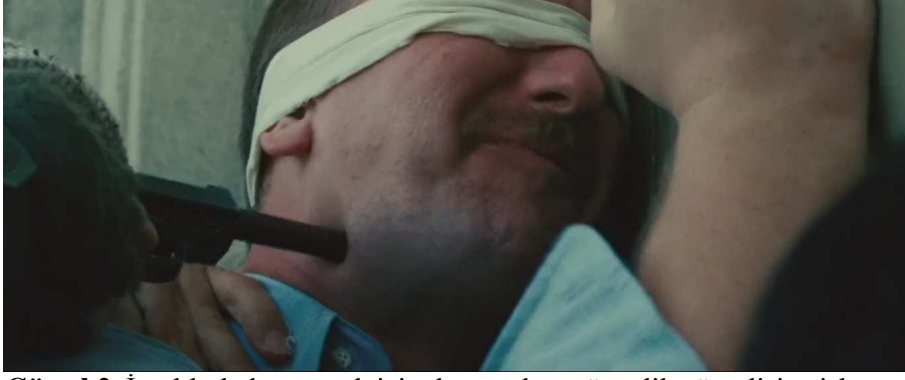
Görsel 2. İranlılarla konuşmak için dışarı çıkan güvenlik görevlisine işkence edilmeye başlanır.

Amerika’da durumu öğrenen bürokrasi çalışanları arasında şu şekilde diyaloglar geçer ;