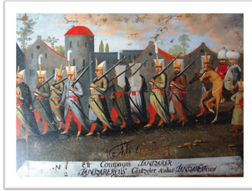
Ek-14 Krigsarkivet (Askeri Arşiv) 36