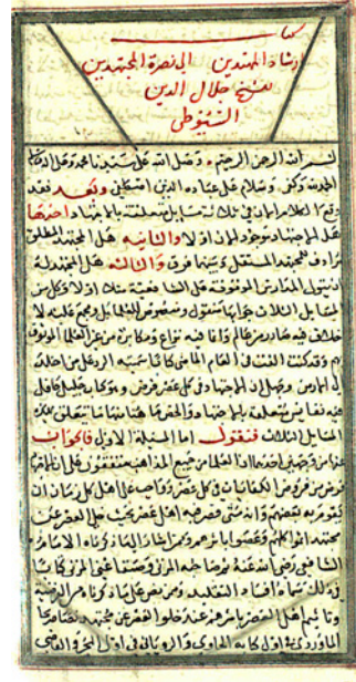
نسخة (أ) الورقة الأولى