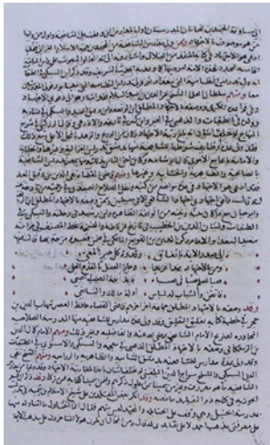
نسخة (ب) الورقة ما قبل الأخيرة (الأخيرة مقطوعة)