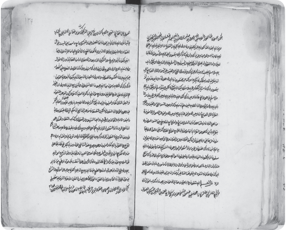
Fols. 128v.- 129r.