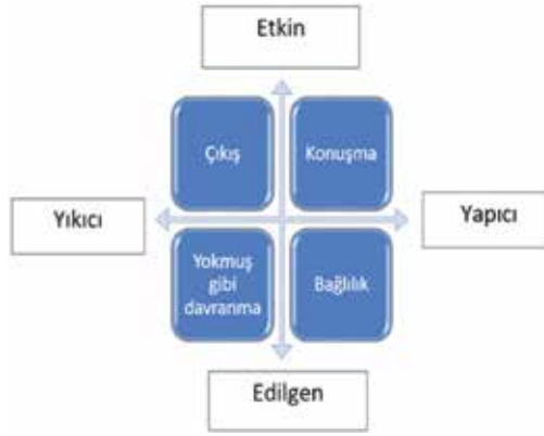
Şekil 1. Yapıcılık-Yıkıcılık ve Etkinlik-Edilgenlik Boyutlarının Kesişiminde Yer Alan Çıkış, Konuşma, Bağlılık, Yokmuş gibi Davranma Tepkileri (Rusbult ve Zembrodt, 1983)