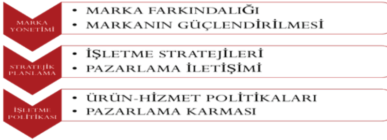
Tablo 1: Marka Yönetimi-İşletme Politikası

Marka Yönetiminde önemli olan marka farkındalığını yaratmak ve markanın güçlenmesini sağlamaktır. Bunun için stratejik planlama yapılmalı, işletme stratejileriyle pazarlama iletişimi bütünleştirilmelidir. Bu unsurların sağlanması işletme politikasıyla ilgilidir.