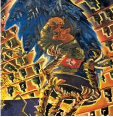
Resim 2: Jörg Immendorff, “Almanya Kafe”, Detay-1.