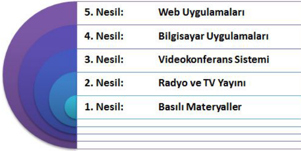
Şekil 2. Uzaktan Eğitimin Tarihsel Gelişimi 4

Uzaktan eğitimlerde birçok farklı ortam kullanılabilir. Bunlar ihtiyaçlara göre seçilen ve tasarlamaya olanak veren ortamlardır. Uzaktan eğitimin ilk ortaya çıktığı yıllarda tek taraflı bilgi aktarımı ve etkileşimi sağlayan mektup, gazete gibi yazılı materyaller araç olarak kullanılırken, günümüzde yeni medya teknolojileri uzaktan eğitim aracı olarak kullanılmaktadır (Kaya ve Odabaşı, 1996, s.79). Kullanılmaya başlanan her yeni teknoloji ile uzaktan eğitim de farklı basamaklara ayrılmıştır.