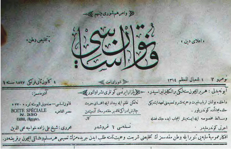
Ek- 1 Kanun-i Esasi'nin logosu ve kapak sayfası.