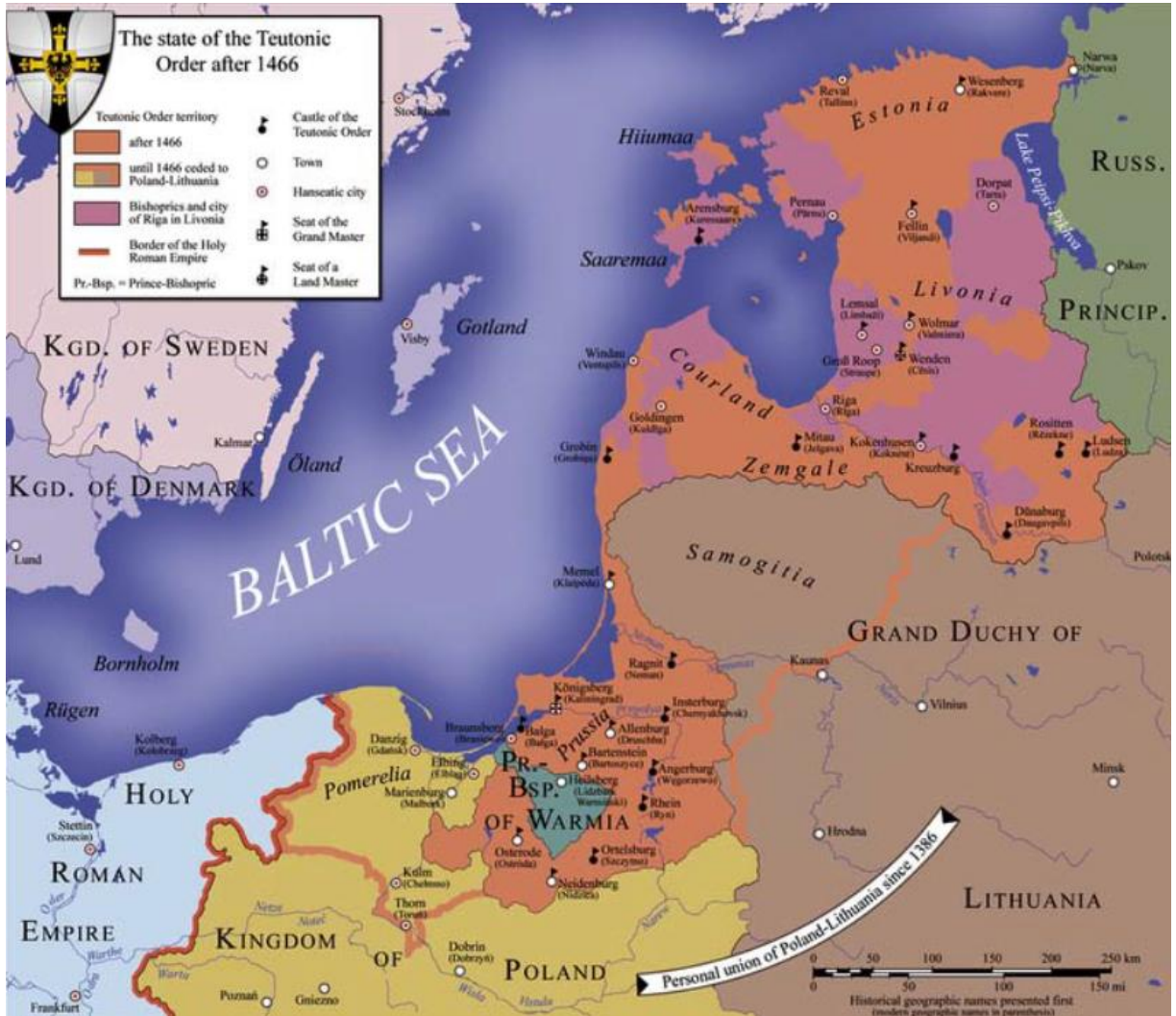
15. yüzyılda Töton Şövalyelerinin hakim olduğu alan. 113

Bütün bu çalışmalar haliyle belirli ticari düzenlemeleri zorunlu kılmaktaydı. Töton Şövalyeleri kanun ve merkezi yönetim hususunda o kadar iyi bir düzey yakaladılar ki bazı araştırmacılar tarafından ilk modern devlet olarak kabul edilmektedir. Bilhassa Büyük Üstat Winrich von Kniprode (1352-1382) döneminde zirveye ulaştılar. 110 Özellikle ticaretle ilgili yasaların şekillenmesinde Hansa Birliğine bağlı şehirlerde uygulanmakta olan Lübeck yasalarının büyük katkısı olmuştur. Bu yasalar başta korsanlık olmak üzere ticari faaliyetleri engelleyici her türlü unsura karşı birlikte yaptırım uygulama ve işbirliği yapmayı getiriyordu. 111 İçeride üretimde istikrar sağlanması amacıyla işçi ücretleri sabit tutuldu. Ücretlerin ne artmasına ne de azalmasına izin verildi. Örneğin bir demirci veya marangozun bir yıllık ücreti 3,5 mark, serbest bir işçininki 1,5 mark, ev hizmetçisinininki 2 mark, hasta bakıcısınıninki ise 0,5 mark'tır. Yine alınan kararlar çerçevesinde efendi, kaçan serfini takip edip yakalama ve akabinde de kulağını delme hakkına sahiptir. Hasat dönemi boyunca serfler evlenemezdi. 112