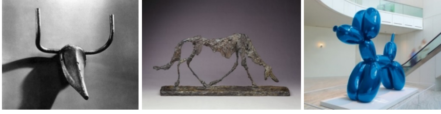
Fotoğraf 4-5-6. Pablo Picasso, 1942, Boğa Başı, Alberto Giacometti, 1951, Köpek, Jeff Koons, 1994-2000, Balon Köpek

Fotoğraftaki eserler tarihin farklı dönemlerine aittir ve bu eserlerin ortak paydası model aldığı doğa gerçekliği, hayvan betimidir ( Fotoğraf 1-6 ). Eserlerde modelin işlenişi ve eserin biçimsel gerçekliği doğrusal biçimde eserin ait olduğu dönemin doğa ve gerçeklik anlayışını ve beraberinde üretim/yaratım anlayışını, kültür anlayışını, insan anlayışını, 'ben'lik anlayışı, sanat ve sanatçı anlayışını, değer anlayışını, katiyet veyahut da görecelik anlayışını göstermektedir. Bu biçimsel farklar aynı zamanda insana ait dünyevi kavramların farklı dönemlerde nasıl vücut kazandığını ve kavramların zaman içinde ne şekilde değişime uğradığını da göstermektedir.