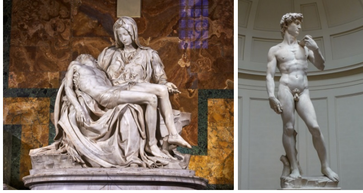
Fotoğraf 10-11. Michelangelo Buonarroti, 1498-99, Pietà, Michelangelo Buonarroti, 1501-04, David

Elbette burada bahsi geçen örnek, Michelangelo Buonarroti, bugün bakıldığında son beş yüz yıllık heykel tarihindeki öncü bir deha olarak belirmektedir. Bizler bugün 21. yüzyılda sanatla uğraşırken ve envaiçeşit konuya değinirken kendi perspektifimizi ortaya koyuyor, kendi bakış açımızdan ödün vermiyor ve eserle birlikte kendi benliğimizden dem vurabiliyorsak, işte bu tip bir sanat ediminin hayati önem taşıyan bir öncüsü Michelangelo'dur denilebilir ( Fotoğraf 10-11 ).