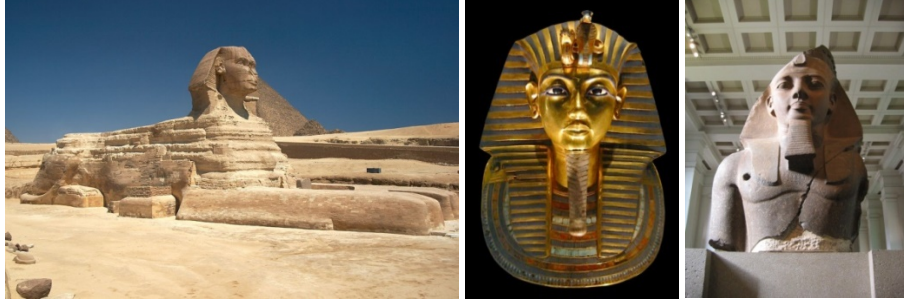
Fotoğraf 7-8-9. Gize Sfenksi, M.Ö. 2500 yılları, Tutankhamun Maskı, M.Ö. 1300 yılları, II. Ramses, M.Ö. 1200 yılları

süren zaman dilimlerinde sanat olgusuna ve sanatçı varlığına dair genel bir anlayış hâkimdir denilebilir.