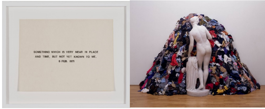
Fotoğraf 15-16. Robert Barry, 1971, Zamanda ve Mekanda çok yakın olan bir şey, fakat henüz bana tanıdık olmayan, Michelangelo Pistoletto, 1967-1974, Paçavralar Venüsü

Bu anlayışın önemli bir çıktısı da sanatçı ve model ilişkisindeki köklü değişimdir. Zira günümüzde bir zamana kadarki genelgeçer haliyle durağan bir zaman kapsamında ve sabit biçimdeki somut bir gerçeklik olan model anlayışından bahsetmek zorlaşmaktadır. Günümüz sanatında sanatçının modeli şimdiki zamanda işleyen soyut ve kavramsal bir model olarak gözükmektedir. Ancak eserin kavramsal içeriği eninde sonunda somut bir malzemeyle, sesle, dille, yazıyla, mekânla veyahut da bir başka nesnenin olanağıyla vücut bulmaktadır. Bu kapsamda kavram ve nesne bağıntısı şartlı bir ilişkisi olarak belirlemektedir (Fotoğraf 15-16).