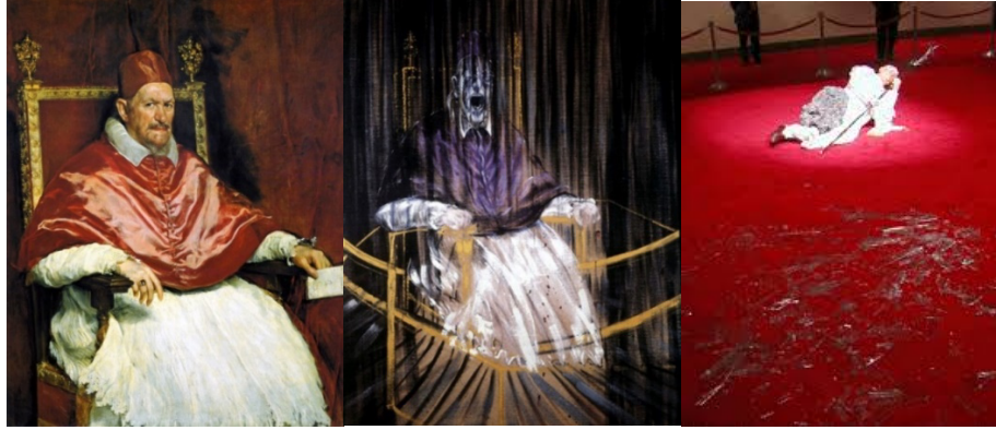
Fotoğraf 12-13-14. Diego Velázquez, 1650, Papa Innocent X Portresi, Francis Bacon, 1953, Velázquez'in Papa Innocent X Portresi Ardından Araştırma, Maurizio Cattelan, 1999, Dokuzuncu Saat

başkalaşıma uğratmıştır (Fotoğraf 12-14). İlerleyen zamandaki ikinci kopuş ise artık biçimin ve dolayısıyla nesnelüğün reddi olarak belirir. Nesnelüğün sorgulanması ve bitmiş bir eser anlayışına karşı ortaya konan yeni değerler sanat olgusunun ve sanat eserinin anlamını, niyetini ve de değerini tamamen farklı bir algıya taşımıştır. Sanatçı için model artık bir nesne olarak değil öncelikle zihinde beliren bir kavram ve fikir olarak kendini gösterir.