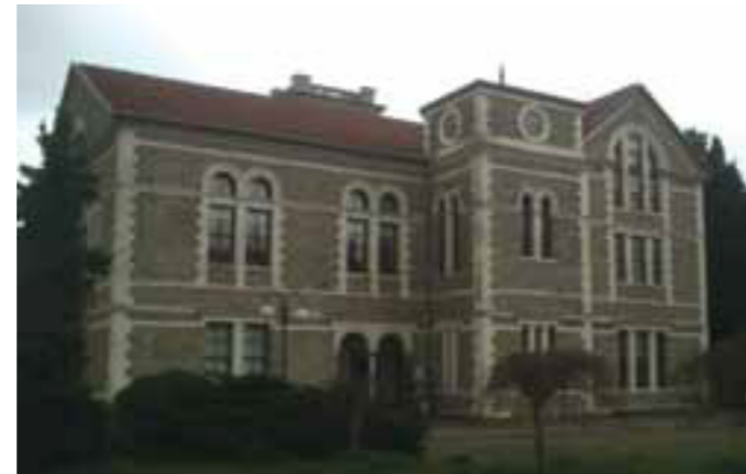
Fig 7. Bosphorus University Grand Meeting Hall (Albert Long Hall)