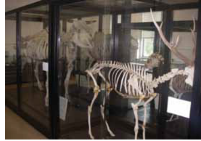
Fig 3. Fossil and Skeleton Department of Hokkaido University

Üçüncü katta fosil ve mineral örnekleri sergilenir. Jeoloji bölümü, çalışmaları süreli sergi bölümünde sergilenmektedir. Deprem araştırmaları, deneyler, tarımın geliştirilmesi ile ilgili yapılan islah çalışmaları, yürütülen genetik çalışmaları, biyoloji çalışmaları sergilenmektedir. Sergi alanlarında kelebek türleri, fosilleri yanında, doldurulmuş ayı gibi canlandırma yapılmış hayvanlar tabiat tarihine kaynaklık eder.