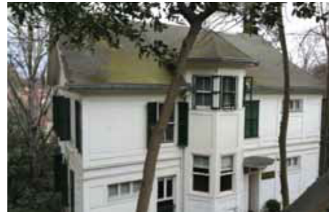
Fig 6. Boğaziçi University Business School Executive MBA Building