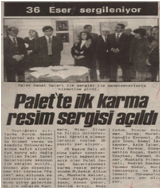
Fig.1. Anadolu Üniversitesi Palet Sanat Galerisi'nin ilk sergi haberi kúpürü (1987)

Üniversitenin Palet Sanat Galerisi'ni faaliyete geçirme amacı (1987), Türk sanatına önemli katkılarda bulunmuş sanatçılarımızın eserlerini kent merkezinde sergilemek, söyleşilerle onların sanat görüşlerini paylaşmak, ayda bir kez de olsa bir sanat olayını gerçekleştirmekti. Sanatçılara destek olmak adına yapıtların taşınması, sanatçıların ağırlanması, afiş, davetiye ve kokteyl giderleri Üniversite tarafından karşılanırken sergilenen bir yapıtın Üniversitemize bağışlanması isteniyordu. Palet Sanat Galerisi bu işlevini aralıksız on bir yıl sürdürerek seksene yakın sanatçıyı kent halkıyla buluşturdu. Sergileme süreci galerinin 1998'de kapanmasından sonra da Yunus Emre Yerleşkesi'ndeki sergi salonlarında aynen devam etti.