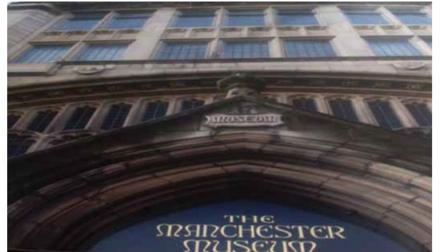
Fig 1. Entrance to Manchester Museum (England)

- Yaşamın Kazanılması Galerisi; dünyada hikayeler bölümünde fosiller, kemikler, mineraller, çeşitli taşlar kaya örnekleri sergilenmektedir.