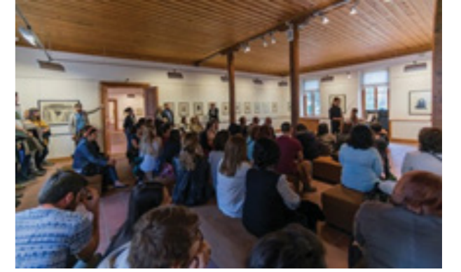
Fig.6. Müzede Müzik konserinden