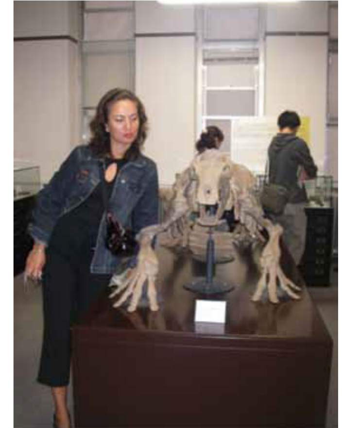
Fig 4. Department of Skeleton, Hokkaido University

olarak karşımıza çıkar. David Alexandre Scott'un anısı için kurulan Kültür Mirası Müzesi (Cultural Heritage Museum) grek mimarisi, gerekse sahip olduğu eşyaları ile bize Scott ailesinin yaşadığı dönemin izlerini yansıtır. Boğaziçi Üniversitesi Müzesi 1986 yılında kurulmuş üniversite tarihi ile ilgili bir müzedir.