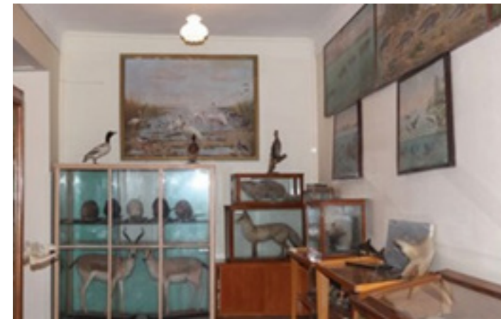
Fig.8. Bakü Devlet Üniversitesi, Ana Bina Kat/3 http://bsu.edu.az/az/content/tkaml_tlimi_muzeyi