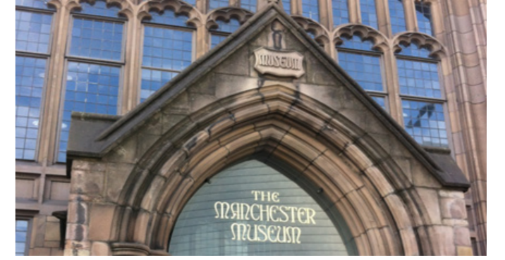
Fig.1. Manchester Üniversite Müzesi Giriş Kapısı

Bu nedenle bu çalışmada; Manchester Üniversite Müzesi'nin 2015 yılı ile 2030 yılları arasında geleceğe dönük stratejik planları incelenmiş, vizyon ve misyonları açısından hedefleri araştırılmıştır. Manchester Üniversite Müzesi'nin stratejik planlar ve sürdürülebilir politikalar üzerinden değişim ve gelişimi projeler üzerinden incelenmiştir. Üniversite müzesinin sahip olduğu değerli kaynaklar; değerler, kalite, ulaşılabilirlik, işbirliktelik, merak uyandırma ve sorumluluk almak Manchester Üniversite Müzesi için oldukça önemlidir. Değişen üniversite müzelerinin, geleceğini planlaması için sürdürülebilir projelere ve stratejik planlara her zaman ihtiyaçları vardır. Bunun içinde müze çalışmalarında değişimin iyi planlanması, müzenin kurumsal yapısına uyarlanması gerekir. İyi planlanan sürdürülebilirlik çalışmaları; müzenin kurumsal yapısının, güvenilirlik politikası ile örtüşmektedir. Manchester Üniversitesi Müzesi'nde Sürdürülebilir projelerin olduğu gibi üniversite müzelerinin gelişimi ve diğer müzelerle rekabet gücünü artırma çalışmalarında, stratejik planların uygulanabilirliği önemli etken olmaktadır.