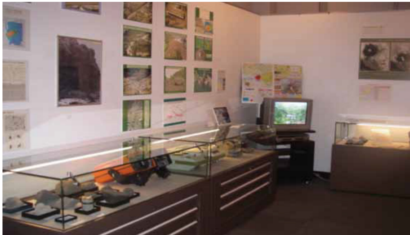
Fig 2. Hokkaido University Museum (Japan)

Üç üniversite müzesi'nin hedef kitlesi yerli ve yabancı araştırmacı ve öğrencilerdir. Bilimsel çalışmalarla üniversiteyi yerli ve yabancı ziyaretçilere tanıtmayı hedeflemektedir. Ayrıca üniversitede bulunan ilgili bölümlere öğrencilere, akademisyenlere, araştırmacılara hizmet vermektedir. Araştırmaya konu olan Manchester, Hokkaido Müzeleri araştırma esaslı kurulmuş müzelerdir. Kendileri enstitü gibi çalışan bilimsel çalışmalara destek veren üniversitenin liberal araştırmacı yönünü destekleyen müzelerdir. Üniversite müzeleri dünyaya bilimsel çalışmalarını sergilerken, müze kurarak