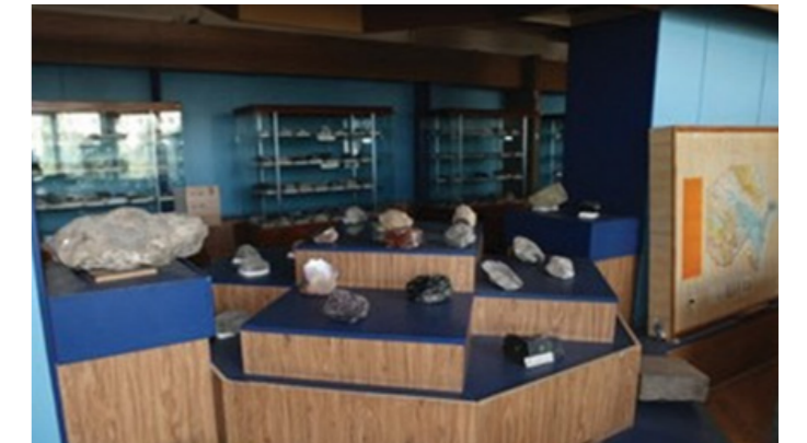
Fig.7. Maden Müzesi : http://bsu.edu.az/az/content/faydal_qazntlar_muzeyi