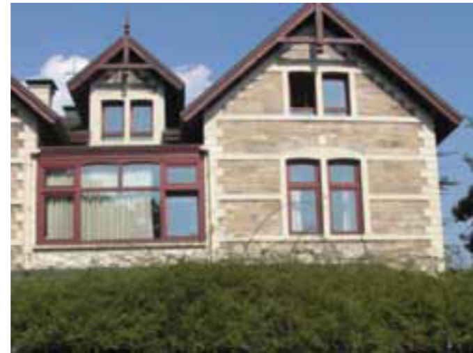
Fig 5. Bosphorus University Kennedy Lodge Building

http://www.imgadd.com/out.php/i21911_nafibabares.JPG