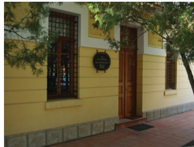
Fig.2. Anadolu Üniversitesi Çağdaş Sanatlar Müzesi

Üniversite koleksiyonu, sanatçılarımızın bağışları, satın almalar, Bilge Karasu'nun hayattayken Üniversitemize bağışladığı özel koleksiyonu ile zenginleşti. Bu birikimi dört duvar arasından çıkarmak ve paylaşma arzusu, Çağdaş Sanatlar Müzesi'nin açılması ile gerçekleşti.