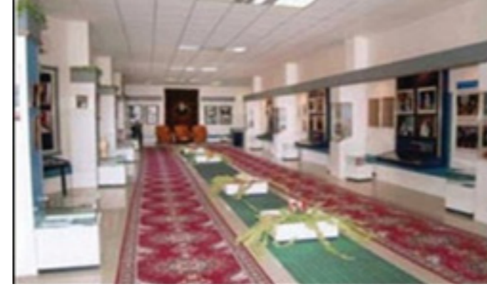
Fig.1. Heydar Aliyev Müzesi http://bsu.edu.az/az/content/h_liyev_muzeyi

https://tr.wikipedia.org/wiki/%C4%B0lham_Aliyev