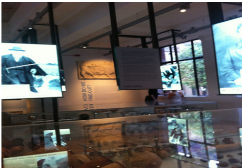
Fig.2. Manchester Üniversite Müzesi Sergi Alanı Aydınlatması

2008 yılında Carcon Trust tarafından müzenin temel enerji kullanımı ve karbon ayak izi belirlenmesi amacıyla müze çalışanları ve ziyaretçiler ile yeşil doğaya uyumlu çeşitli projeler geliştirilmiştir. Bu projelerden biri: Müze Işığı Görüyor (The Museum Sees the Light) projesi dir. Proje kapsamında; müzenin temel enerji tüketimini azaltmak, tasarruf sağlayacak çalışmalar için müzenin ışıklandırılması, sıcaksu temini ve mekan ısıtmasına yönelik çalışmalar yürütülmüştür. Müzenin eski binalarında Viktorian tarzı demir radyatörleri, ana kazandan dağıtılan sistemle ısıtılması maliyetleri yükseltmiş olsa da verimli ısınma sağlanamamıştır. 2002 yılında bazı binalarda kurulan yeni ısıtma sisteminde, her binada tüketimi aza indirecek düzenlemelere ihtiyaç duyulmuştur.