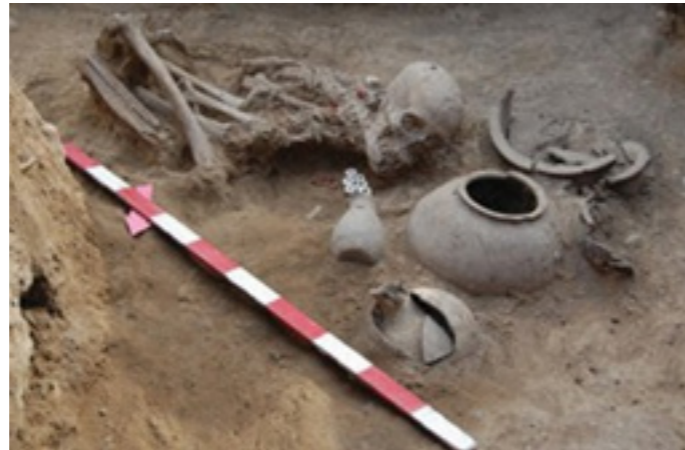
Fig.3-4. Üniversite Tarihi Müzesi http://bsu.edu.az/az/content/h_liyev_muzeyi