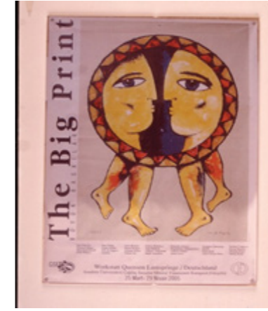
Fig.4. Quensen Büyük Baskılar Sergisi Afişi

Müze koleksiyonunun oluşum sürecinde bağışlar ve satın almalar dışında farklı yollardan bu birikime katılan eserler de oldu. Leopold Levy'nin "Model Emine'nin Portresi" adlı küçük gravürü Üniversitemiz depolarındaki eser taraması sırasında bulundu. Vakıfbank Eskişehir Merkez Şubesi Hizmet Binası'nın yeniden inşaatı için yıkımı sırasında fark edilen Adnan Turani'ye ait 187x437cm. boyutundaki Yunus Emre konulu yağlıboya tablosu o dönemdeki yöneticilerin girişimi ile Üniversiteye alındı. Feyhman Duran'ın 1998 yılında İstanbul Eyüboğlu Sanat Galerisinde tek olarak sergilenen yağlıboya Atatürk portresi sıkı pazarlıkla Müzeye kazandırıldı.