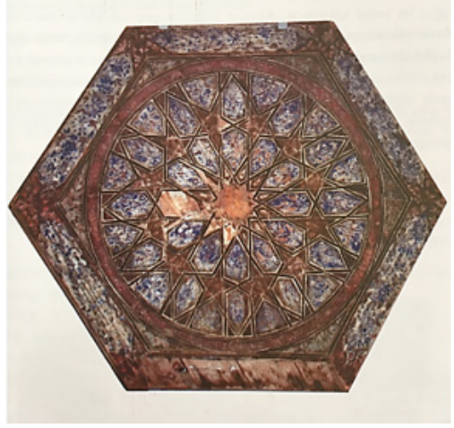
Fotoğraf 4. Solda: Merkezi simetrik tasarım iki farklı modüler dilimden oluşmaktadır, silisli kâse, sıraltı süsleme, Selçuklu, İran, XIII. yy. başı (Pancaroğlu, 2007, s. 98); Sağda: Taklit kündekari tekniğinde yapılmış merkezi simetrik taban göbeği, Konya-Ereğli, Osmanlı, XIX. yy. (Erdemir, 2007, s. 200-201, res. 111a, 111b).

Merkezi simetrik kompozisyonlarda merkez etrafında dönerek tekrarlanan modüllerin şekline bağlı olarak tasarımları durağan veya devingen gruplara ayırılmak mümkündür. Buna göre ucu sağ veya sol yöne kıvrılan motif türleri merkez etrafında yan yana dizildiğinde Türk sanatında çok sevilen ve olumlu anlamından dolayı yaygın kullanılan çarkıfelek simgesini anımsatan görseller merkez etrafında sağ veya sol yöne kıvrılmakta kuvvetli bir hareket barındırmaktadırlar. Benzer görselliğe motiflerin özel dizilişi sayesinde de ulaşılabilir. Anadolu'da bu tarz tasarımlara kubbe içlerinde, ahşap kapı kanatlarında, tavan göbeklerinde, seramik kâse ve tabaklarda daha sık rastlanmaktadır (Erdemir, 2007, s. 235; Kuban, 2008, s. 307, Resim 231; Henshaw, 2010, s. 72, Fig. 36). Sahip Ata Türbesi, Karatay Medresesi Taç kapısı, Sırçalı Medrese kemeri ve mihrabı, Malatya Ulu Cami kubbesi içinde karşımıza çıkan çarkıfelek motifinin Türk sanatındaki iki, üç, dört ve diğer sayıda kollu versiyonlarına rastlanmaktadır. (Foto. 5)