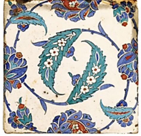
Fotoğraf 3. Solda: (Grube, 1994, s. 89, no. 80). Sağda: Çini plaka, polikrom sır altı süsleme, 1575, İznik, Osmanlı. 3