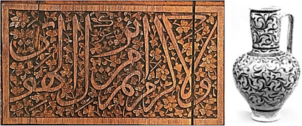
Fotoğraf 8. Solda: Ahşap pencere kanatları üzerindeki serbest asimetrik düzene sahip yazı panosu, Konya, XIV. yy. başı (Şahin, 2009, s. 147); Sağda: Seramik ibrik, serbest asimetrik düzenlemeli bitkisel sır altı süsleme, İran, Keşan, XII. yy. başı (Ettinghausen, 1970, s. 118, Fig. 8)

Daha çok minyatür ve resim sanatına özgü olan serbest düzenlemeler motiflerin çerçeve içinde doğal haline yakın natüralist şekliyle betimleme veya hiçbir simetri ve tekrar içermeyen serbest dizilişle seçilmektedirler. Bunlar manzara tasvirleri veya öyküsel içerikli çok figürlü minyatürlerde, resim ve grafik çalışmalarında, duvar fresklerinde alışılmış şekilde uygulandığı gibi seramik, taş veya alçı panolarda, açık form maden ve seramik kapların dairevi göbek kısımları, kapalı formlarda ise bordürler veya çeşitli kartuş çerçeveler ile bazı dokumalı ürünlerde karşımıza çıkmaktadırlar. Serbest düzenlemelerin soyut grubunu temsil eden ebru, hat, el işlemleri gibi örneklerde süslemeler geometrik veya stilize tarzıyla seçilirler. İster gerçekçi ister ise soyut tarzındaki serbest kompozisyonların ortak yönü motiflerin asimetrik düzen içinde bulunması ve çerçeve içindeki alanda her betimlemeye özgü tercih edilmiş serbest yayılım göstermesinden ibarettir.