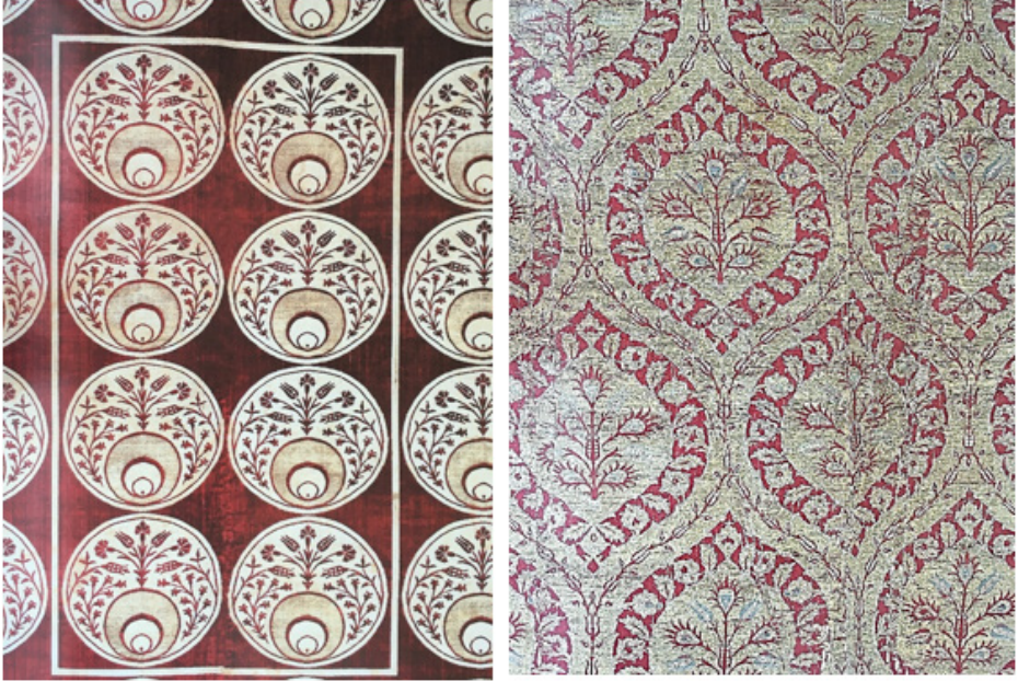
Fotoğraf 6. Solda: Kadife “çatma” pano detayı, Osmanlı, XVI. yy., (Bilgi, 2007, s. 60, no.19); Sağda: İpekli dokuma “kemha” detayı, Osmanlı, XVI. yy., (Bilgi, 2007, s. 40, no.9).

ipliğin tükenmesinden değil, sanatsal düzeydeki kaygılardan kaynaklanmış olmalıdır (Aslanapa, 2005, s. 170, Levha 88).