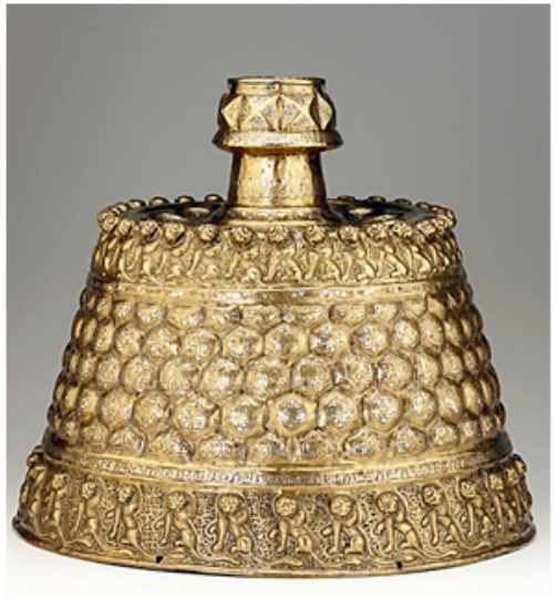
Fotoğraf 7. Solda: Kumaş Deseni kompozisyon tarzında baklava dizilişinde mozaik çini, Karatay Medresesi kubbesi, Selçuklu, XIII. yy. (Erdemir, 2009, s. 125, res. 60); Sağda: Gövdesinin en geniş orta şeridi kumaş deseni'nin baklava dizilişinde kabartmalı olarak süslenmiş şamdan, tunç, döküm, Afganistan, XII. yy. 2. Yarısı (Baer, 1983, s. 31, no. 21).