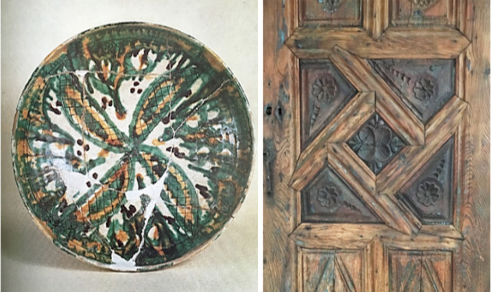
Fotoğraf 5. Solda: Merkezi simetrikli düzen içinde oluşan dörtlü çarkifelek simgesi, Kazımalı-akıtmalı seramik tabak, Afrasiyab, Horasan, IX-X. yy. (Ainy, 1980, No. 82); Sağda: Ahşap kapı kanadı süsleme detayı, Akseki Sarıhacılar Köyü Etnografya Müzesi koleksiyonundan.