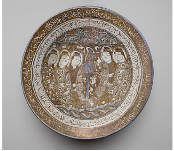
Fotoğraf 2. Solda: “ Monstera deliciosa ” türünden tropikal bitki yaprağı; Sağda: Lüsterli kase, Selçuklu, İran, XIII. yy., The Brooklyn Museum koleksiyonundan. 2

Türk sanatında ayna simetrlili düzenlemelerin bir diğer alt versiyonu ters ayna simetrlili kompozisyon şemasıdır. Nispeten daha ender uygulanan bu düzeni temel şemadan farklı kılan husus, orta eksen çevresinde tekrarlanan görselin ters-düz şekilde yerleştirilmesidir. Muhtemelen bu uygulamanın ortaya çıkma nedeninin arkasında da mekanik tekrar şeklindeki algının daha serbest ve devingen bir hale ulaştırmak amacı durmaktadır. Aşağıda sözü geçen merkezi simetrlili kompozisyonların ikili tekrar şemasıyla örtüşen bu kompozisyon çeşidini her iki şekilde tanımlamak mümkündür. (Foto.3)