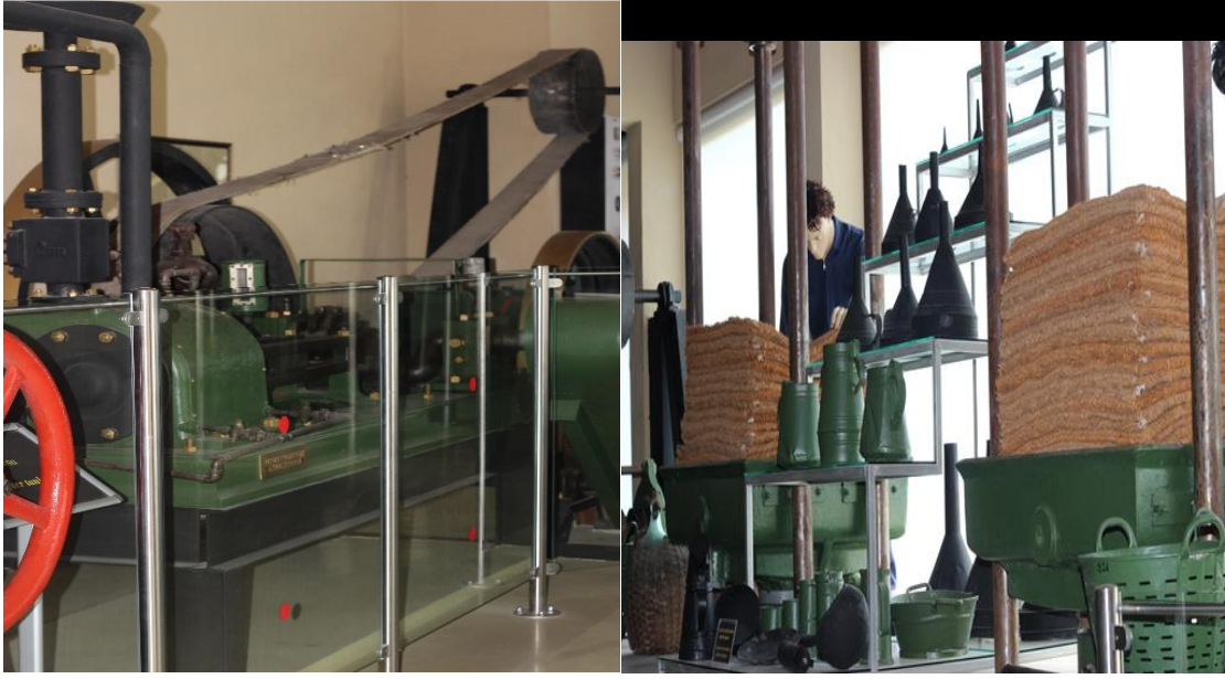
Resim 4: Erken Sanayi Dönemi'ne ilişkin bölüm