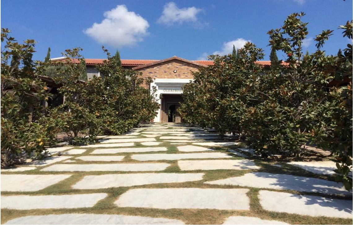
Resim 1: Müzenin girişi