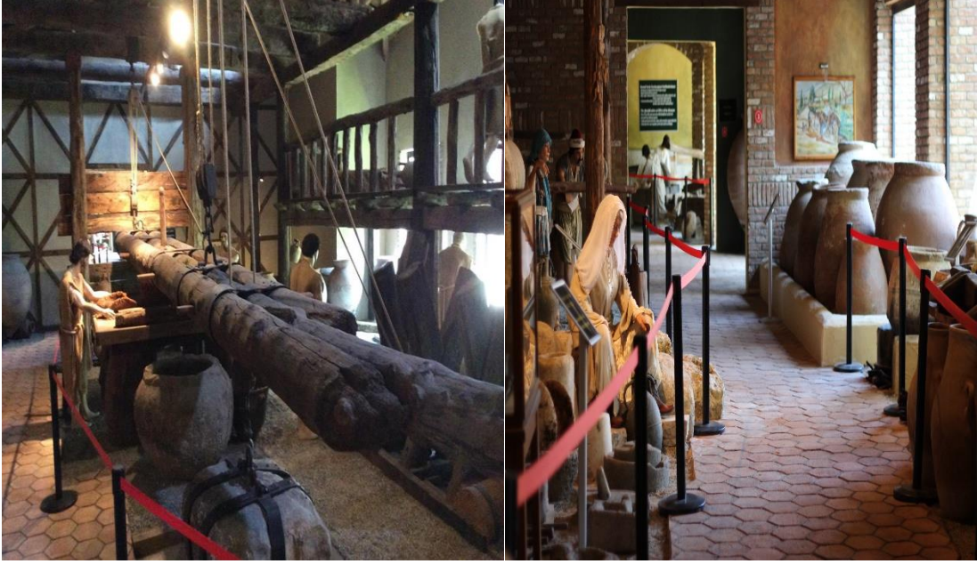
Resim 2: Müzede zeytinyağı üretimine ilişkin canlandırma