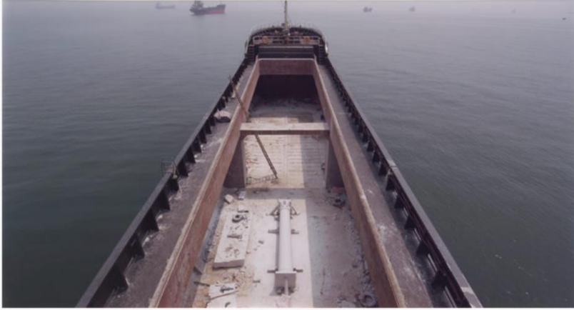
Resim 2. Adrian Paci, “Column”, Video, 2013.