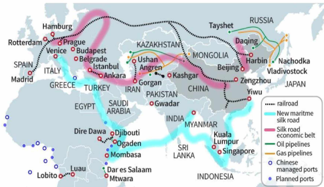
Table I, Infrastructure projects being planned and undertaken in China's Belt and Road Initiative.