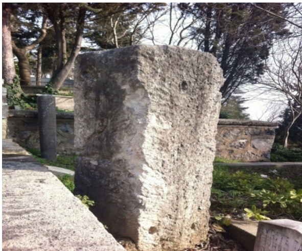
(Cellat Mezar Taşı-Eyüp)

Bu nedenle hangi taşın hangi cellât'a ait olduğu da bilinmemiştir. Osmanlı devleti, düşünce ve anlayış olarak bu denli ayrıntılara dahi önem vererek yüksek kültür ve medeniyet olma bilincine ulaşmıştır.