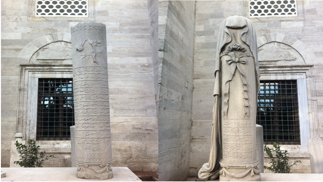
(Kopuk Gül Motifli Hanım Mezar Taşı- Süleymaniye) (Duvak Motifli Hanım Mezar Taşı-Süleymaniye)

Atalarımızın saygı, sevgi ve anlayışa dayanan derin kültür ve medeniyetine farklı bir örnekte Süleymaniye camii haziresinde bulunan iki hanım mezar taşıdır. Avrupa'da kadın insan mıdır, değil midir tartışılırken kadim medeniyetimiz, Osmanlı mezar taşlarında hanımları güle benzetmiş, vefatını ise kırılmış gül tasviriyle sunmuştur. Aynı zamanda evlenmeden evvel vefat eden genç kızların mezar taşlarını duvak motifleriyle süsleyerek vefatından sonra dahi hanımlara verilen kıymeti yansıtmışlardır.