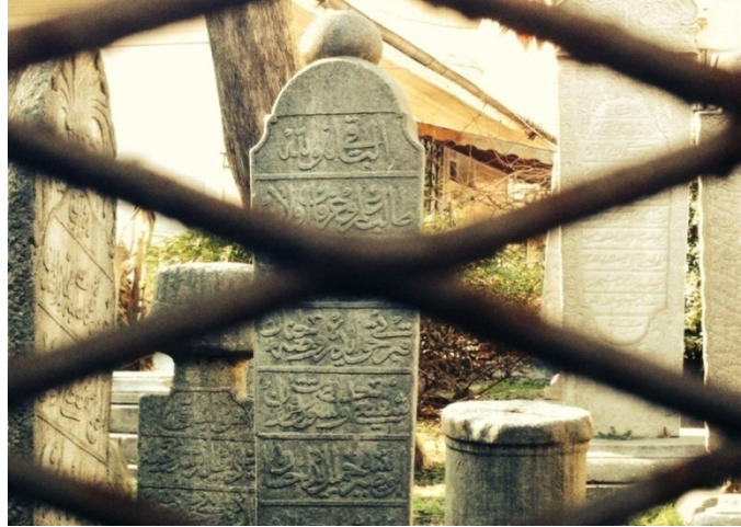
(Sadaka Taşları ile Osmanlı Mezar Taşları İççe-Eyüp)

Mezar taşları arasındaki bu sadaka taşlarının vefat eden kişinin ardından hayır işlemek, amel defterinin açık kalmasını sağlamak amaçlı yakınları tarafından dikildiği de düşünülmektedir.