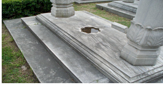
(Su çukurlu Osmanlı Mezar taşı Örneği- Eyüp)

Osmanlı'da cellâtların mezar taşları da bizlere dönemin toplum yapısını sunma noktasında yardımcı olacaktır. Bilindiği üzere İslam inancında can almaya yer yoktur. Osmanlı toplumunda da cellâtlar hoş karşılanmamış, mezar taşları toplum tarafından dışlanmıştır.