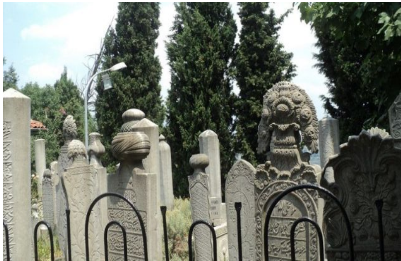
(İnsanların Geçiş Güzergâhına Bakan Mezar Taşları)

Ayrıca; Osmanlı mezar taşları her durumda bulunduğu yerde caddeye, pencerelere ve insanların geçiş istikametlerine bakmaktadırlar. Bu durumun en önemli nedenlerinden biri insanların mezar taşlarını okumasını sağlayarak ibret vermek, ölümü hatırlatıp ölüm düşüncesini canlı tutmak ve gömülü kişinin dua isteğine yanıt bulmasını sağlamakken bir diğer sebebi ise meftun kişinin sosyal hayata sırt dönmesinin önüne geçilmesi isteğidir. Böylelikle üzerinde çeşitli mesaj, simge ve motiflerin bulunduğu mezar taşları, meftun ile sosyal hayat arasında iletişim sağlamada köprü görevi görmüştür.