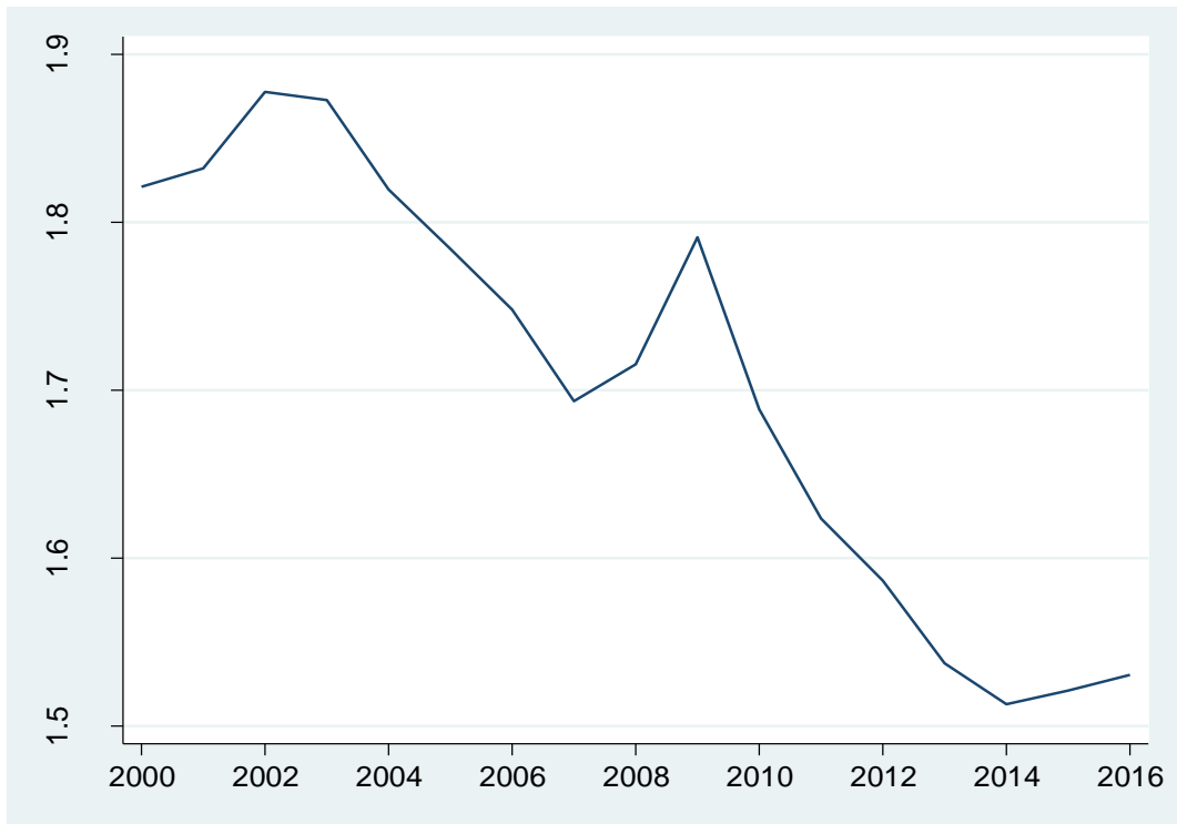
Tablo 3: Savunma Harcamalarının GSYH içindeki % payı (OECD ülkeleri ortalaması)