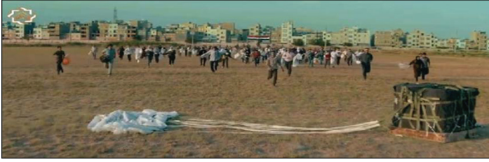
Resim 3: İran'ın hava yolu vasıtasıyla yaptığı yardımlar