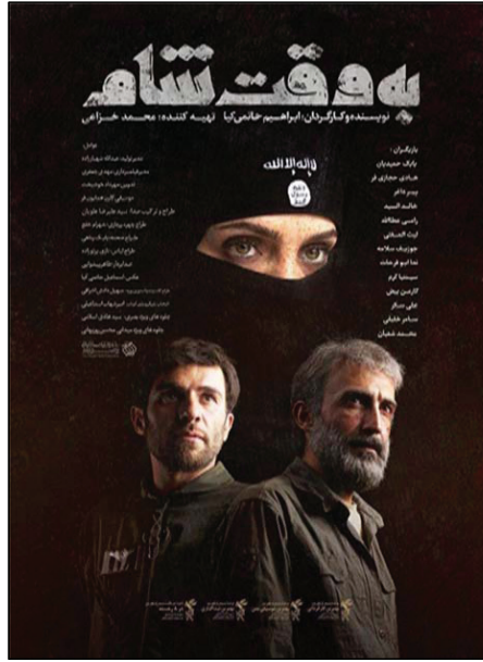
Resim 1: Filmin tanıtımında kullanılan bir afiş