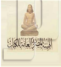
Şekil 3. 1971'de kurulan el-Hey'eti'l-mısriyyeti'l-âmmeli'l-kütüb logosu

Kültür kurumlarının logo tasarımlarında da benzer seçimler yapılmıştır. Antik Mısır alanında en çok kitap yayınlayan yayınevlerinden olan bugün hala Mısır Ulusal Kütüphanesi'ne ait binada hizmet vermekte olan el-Hey'eti'l-mısriyyeti'l-âmmeli'l-kütüb yayınevinin amblemi de antik Mısır giysileri içinde bir Mısırlıyı kitap okurken tasvir etmektedir (Bkz. Şekil 3).