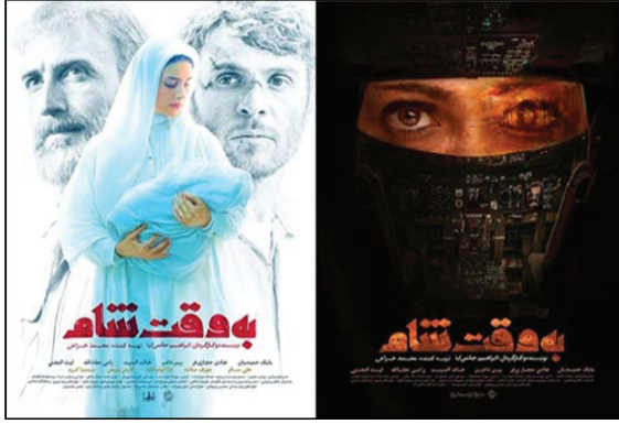
Resim 2: Filmin tanıtımında kullanılan afişler

ve kaçırdığı uçak ile intihar saldırısı yapacak olan bir kadın resmedilmiştir. Kullanılan fona bakıldığında hem kara bir çarşaf giyinmiş IŞİD’li kadın bir militan, hem de bir uçak kokpiti görülmektedir. Görsellerde bir taraf hayatı sembolize ederken, diğer taraf ölüm ile eş değer tutulmaktadır.