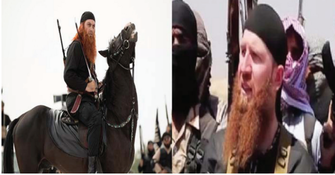
Resim 4: Filmde (sol) ve gerçek hayatta (sağ) Ömer Şişani.

Bu diyalog ile amaçlanan, IŞİD tehlikesine karşı hem İran kamuoyunu hem de dünyayı uyarmaktır. İran'a göre İslam adına savaşmak İsrail'i hedef almayı da kapsamaktadır. Ancak IŞİD'in İsrail yerine Türkiye, Suudi Arabistan ve İran gibi Müslümanların çoğunluk olarak yaşadıkları yerleri tehdit etmesi ile onun İslam adına savaşmadığı izlenimi uyandırılmaktadır. 53 Diğer taraftan, sahada farklı örgütleri destekleyen ve farklı siyasal çıkarları olan İran, Suudi Arabistan ve Türkiye'nin aslında aynı tehdide karşı savaştıkları gösterilmektedir. 54