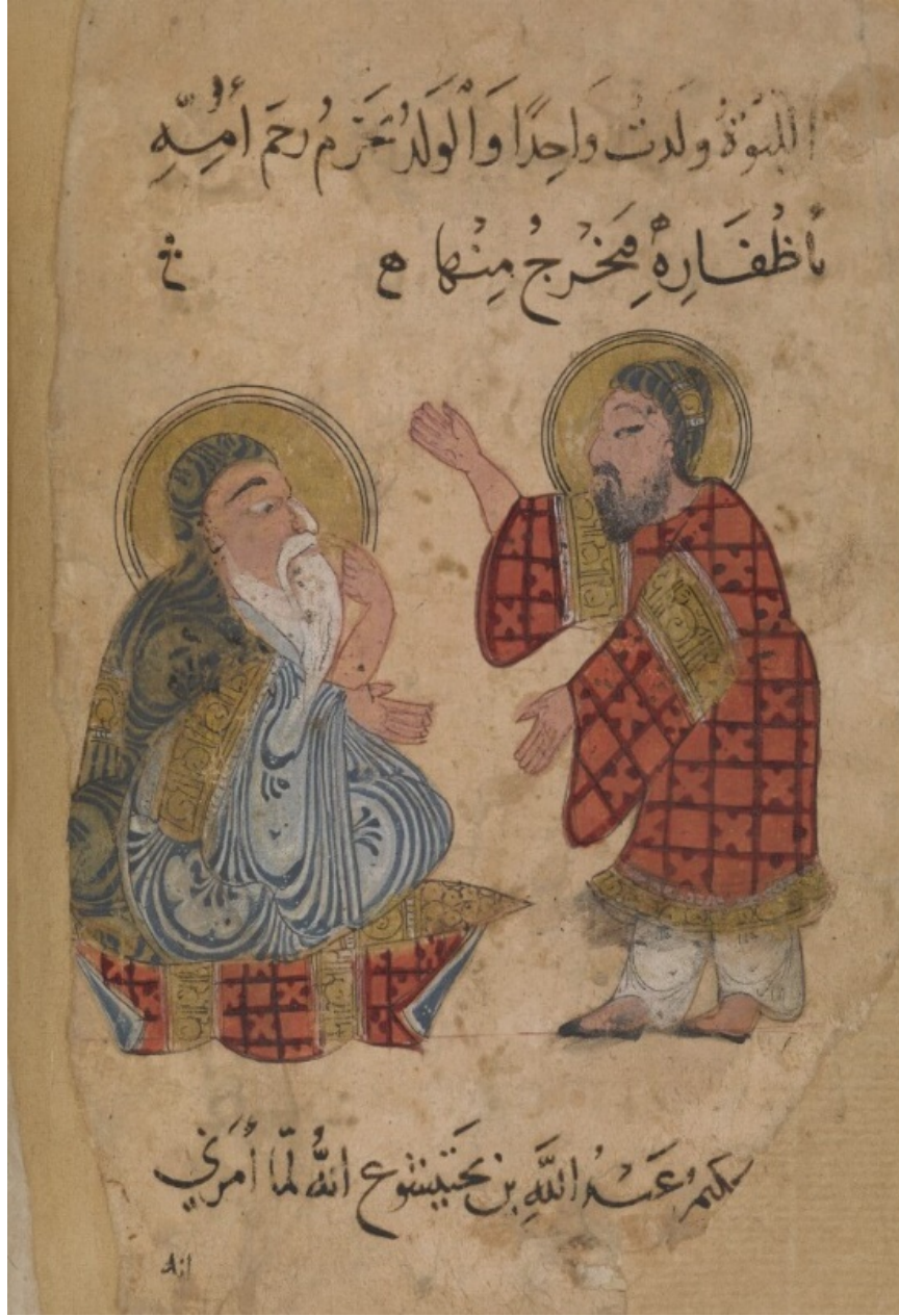
Resim 1: Buhtîşû' ailesinden Ubeydullah b. Cebrâil (ö. 450/1058'den sonra) bir öğrencisine ders verirken (7/13. yüzyıla ait Kitâbu Na'ti'l-Hayevân , British Library, Or 2784, v. 102 a )