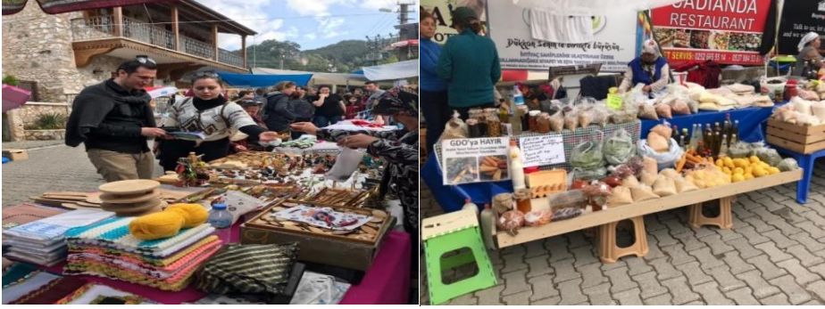
Foto 1-2: Yöreye Özgü Ahşap Hediyeliklerin ve Yöresel ve Doğal Ürünlerin Satıldığı Tezgâhlardan Görünüm