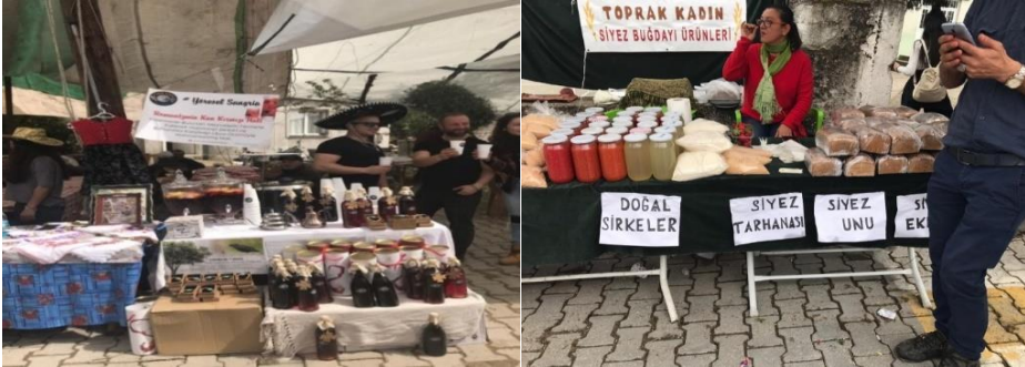
Foto 3-4: Yöresel Likya Şaraplarından Sangria ve Doğal ve Yerel Ürünler