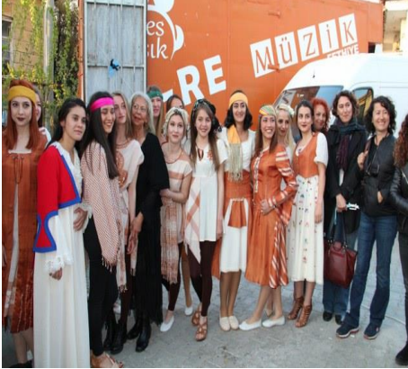
Foto 9: Yeşilüzümlü ve Bölgesi Kuzugöbeği ve Dastar Festivali (El Dokuma Dastar Giysileri Gösterisi)