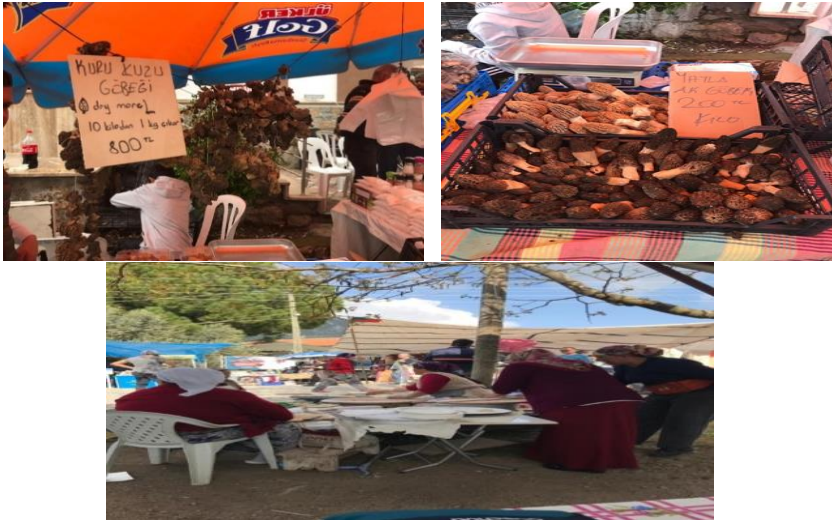
Foto 5-6-7: Kuzugöbeği Mantarı Kilosu- Kuzugöbeği Gözlemesi Yapan Yöre Kadınları

Tıbbi açıdan da birçok faydası olan, doğal antibiyotik olarak oldukça fazla kişi tarafından alınıp çorbası yapılabilen, mantar sote olarak farklı sebzelele karıştırılabilen, yumurta, soğan ve biber ile kızartılabilen ve aynı zamanda gözlemesi de meşhur olan kuzugöbeği mantarı hem yerel halka ve katılımcılara hem de yurt dışına pazarlanmaktadır. Fethiye Belediyesi Kültür ve Sosyal İşler Müdürlüğü'nden alınan istatistikî bilgiye göre 2018 ve 2019 yıllarında festivalde ortalama 250-300 kilo arasında ziyaretçilere kuzugöbeği satılmıştır.