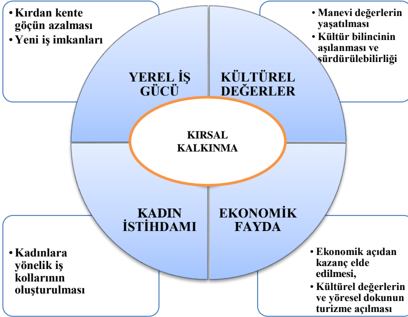
Şekil 1: Kırsal Kalkınmanın Sağladığı Avantajlar

Şekil 1’de görüldüğü üzere kırsal kalkınma sayesinde; yerel iş gücü gelişmekte, kültürel değerlerin yaşatılması ve varlığının sürdürülebilmesi sağlanmakta, yeni iş kolları meydana gelmekte ve ekonomik kazanç elde edilmektedir. Bu bağlamda kırsal turizmin ekonomik, sosyal ve kültürel değerleri dikkate alındığında, ülkelerin kırsal alanların kalkınmasında farklı ürün ve projeleri desteklediği görülmektedir. Çalışmada da kırsal turizm kapsamında ele alınan ve kültürel değerlerin ekonomik kazanç olarak ön plana çıkmasında önemli bir role sahip olan Yeşilüzümlü festivali arz yönlü değerlendirilmiştir.