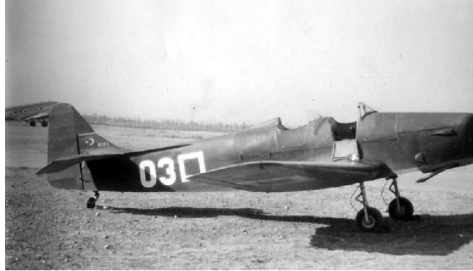
Miles Magister Uçağı

rının lisansı alınarak bombardıman uçaklarının montajı da bu dönemde kazanılan kabiliyetlerdendir 34 . Kayseri uçak fabrikasında bu dönemde uçak Fabrika Seviyesi Bakım (FASBAT)'ı ve motor revizyon (RN) faaliyeti de devam etmiştir. 1932 tarihinde çıkarılan 3526 sayılı kanunla Eskişehir ve Kayseri Fabrikalarına esaslarını Milli Savunma Bakanlığı belirlenmek kaydıyla Türk Hava Kurumu, Devlete ait daireleri ve kurumlar ile dışarıdan sipariş alma yetkisi verilmiştir 35 . Havacılığın kalkınması için o döneme göre oldukça ileri bir adımdır. Kayseri'de ilk Türk Harp Tayyaresi üretimi millet nezdinde büyük bir gurur kaynağı olmuştur. Türk Hava Kuvvetleri'nin koruyan ve Korkutan bir kuvvet olması yolunda atılmış bu önemli adım dikkatlerin bir kere daha havacılığa odaklanmasını sağlamıştır. Bu sonucun alınması için vatandaşlar hemen her meslek ve ortamdan ciddi olarak destek vermişlerdir. Para yardımı, fitre, zekat ve kurbanlarını gönüllü olarak Türk Hava Ordusuna bağışlamış ve bunu dini vecd ile yapılan bir vatan hizmeti olarak görmüşlerdir 36 .