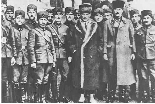
Çağ Yakalama Temel hedef olmuştur

nayine bakınız... Birinci Dünya Savaşı biter bitmez, bu kara günlerde kullanılan tüm silahlar birden bire demode oluverdi. Almanlar, Fransızlar, İngilizler, Amerikalılar ellerindeki bu silah fabrikalarını uzun vadeler tanıyarak geri kalmış ülkelere satmaya çalışıyorlar. Neden? Çünkü onlar daha modernlerini, daha etkili olanları yapabilecek fabrikalar kurmakla meşguller... Bunu her alana yayabilirsiniz. Tekstil alanına, ilaç sanayi alanına, otomotiv sanayine; kısaca aklımıza gelen her alana... Biz yeni ve genç bir Türkiye kuruyoruz. Dost düşman ülkelerin geride kalmış, teknolojilerine gereksinmemiz yok. Ya en yenisini kurar, onlarla boy ölçüşürüz, ya da biraz daha sabreder, bunu yapabilecek güce erişmemizi bekleriz 8 ”. Bu sözler onlarca yıl önce sanayinin bu günkü seviyesinden çok ilkel olduğu bir dönemde tespit edilmiş bir hakikattir. Bu gerçekleri bu gün çok daha açık olarak görmekteyiz.