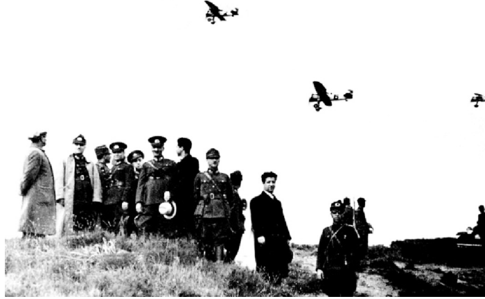
Atatürk Manevrada Uçakları İzlerken

TOMTAŞ'ın yaşatılamaması büyük bir kayıp ve başarısızlıktır. Gerçi burada Junkers'in sorumluluğu daha fazladır. Ancak Türkiye bu denemesinde başarılı olsaydı iyi bir başlangıç olacaktı. Peki, bu faaliyetler gelişmiş sanayilerde nasıl yürütülmektedir? Alman Krupp Firması, devletten 18.000.000 Reichmark tutarında top siparişi ve beraberinde 15.000.000 Reichmark da avans almıştır. Toplar üretilmiş ama teslim aşamasında Muayene Heyeti tarafından şartnameye uymadığı gerekçesiyle ret edilmiştir. Krupp Şirketi, fabrikası dışında her şeyini satıp borcunu ödemeye çalışmaktadır. İmparator Kayzer II. Wilhelm, Krupp yetkililerini çağırır ve bir çek vererek, “Dökümleri fırına atınız, yenisini yapınız, bunda da muvaffak olamazsanız yine geliniz.” diyerek Alman sanayine ne kadar önem verdiğini ortaya koymuştur 40 . Özel sektör Almanya'da devlet tarafından bu şekilde desteklenirken maalesef Türkiye'de bu süreci yaşamak mümkün olmamıştır. Birkaç öngörülü kişi dışında yetkililer Türkiye'nin geleceğini planlama yetisinden yoksun kalmışlardır.