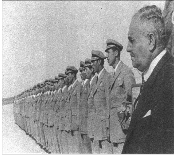
Nuri Demirağ ve Pilot Adayları

Osmanlı İmparatorluğu askeri havacılığı kuran ilk ülkelerden biri olmuştur. 1913 yılından itibaren hava harp sanayi alanında bazı girişimler yapılmıştır. Ülkenin koşullarının müsait olmaması ve Osmanlı Devleti'nin içinde bulunduğu şartlar gereği başarı sağlanamamıştır. Birinci Dünya Savaşı yıllarında yine birkaç uçak fabrikası etüt yapmış ama yatırım yapılması için uygun koşulların henüz oluşmadığı sonucuna ulaşılmıştır. Oysa Osmanlı Devleti'nin savaşı kaybetmesinde önemli bir etken hava hakimiyetinin kaybetmesi olmuştur. Yukarıda da ifade edildiği gibi, dünyada üretilen 165.000 uçağa karşın, Osmanlı envanterine giren uçak sayısının Alman Paşa Bölükleri dahil 450 civarında kalması sorgulanmalıdır 3 .