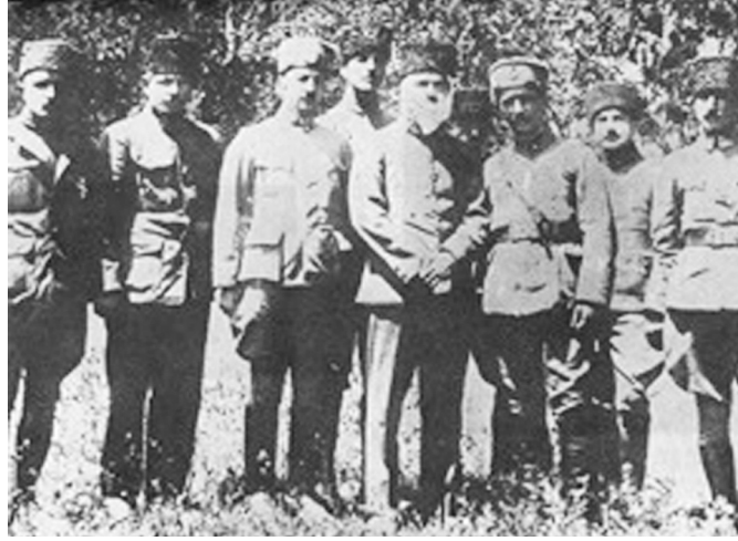
Batı Cephesi'nde İsmet İnönü ve Havacılar

İstiklal Harbi'nde düzenli ordunun kurulması süresinde ilk kurulan teşkilatlardan biri Hava Kuvvetleri olmuştur. 13 Haziran 1920 tarih ve MSB.İğınının 328 sayılı emri emri ile ilk hava birlikleri teşkil edilmiştir. İstiklal Savaşı yıllarında Türk ordusunun başarısında hava kuvvetlerinin önemli katkısı olmuştur. Karargahın; duyan kulağı, gören gözü olmuş ve Yunan hava unsurlarını Türk cephesine yaklaştırmamış, etkin bir hava hakimiyeti kurmuştur. Ancak bu başarının temelinde yetenekli ve ülkesinin bağımsızlığına inanan ordu mensupları kadar gerekli silah sistemlerinin de teminin önemli katkısı bulunmaktadır. Bununla birlikte İstiklal Harbi'nin son zamanlarına kadar yeterli uçak temini mümkün olmamıştır. Savaş yıllarında Türkler bazen uçaksız kalmış, bazen 2-5 uçağa sahip olmuşlar en fazla 15-17 uçağa sahip olmuşlardır. Oysa aynı tarihlerde Yunanlar 100 civarında uçağa sahip olmuştur. Şüphesiz İngiltere'nin finanse ettiği bir Yunan ordusu ile 11 yıl fasılasız savaşan ve ekonomik kaynakları kuran, dış ülkelerce tecrit edilen Türk Milli Kurtuluş Savaşı'nın farkının bulunması olağandır 2 .