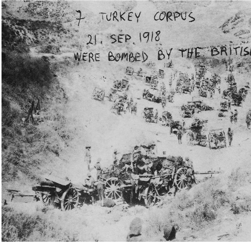
Filistin Cephesi'nde Türklere Yönelik İngiliz Hava Taarruzları Görüntüsü

Mustafa Kemal Paşa; uçakların gücüne ve harplerdeki belirleyici etkisini daha Trablusgarp Savaşı'nda şahit olmuştu. Balkan Savaşlarında, Birinci Dünya Savaşının Çanakkale ve Irak-Filistin Cephelelerinde de bu gelişmeye yakından şahit olmuştur. Birinci Dünya Savaşı yıllarında dünyada yaklaşık 165.000 uçak üretilmesine rağmen Osmanlı ordu envanterine giren uçak sayısı 300 civarındadır. Alman Paşa bölükleri ile bu sayı 450'yi bulmaktadır 1 .