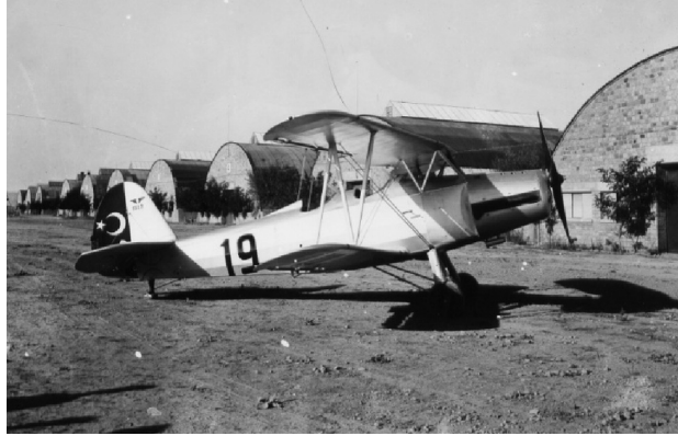
Kayseri Uçak Fabrikasında İmal Edilen Gotha-145

Vecihi Hürkuş'a göre eğer bu fabrika işletilebilseydi II. Dünya Savaşı'nda bir uçak satıcısı olacak olan Türkiye'nin hazinesine altın yağacaktı. 3 Mayıs 1928'de yukarıda bahsedilen nedenlerle şirket faaliyeti sona ermiştir. Junkers ile Türk Tayyare Cemiyeti arasında bir protokol ile tüm hisseleri ile bilumum haklarından feragat ederek 520.000TL.'ye Türk Tayyare Cemiyeti'ne devredilmiştir 24 . Junkers Firması ile olan anlaşmazlık çözümlenmiş ve hisselerin alınmasına müteakip 1930 yılında fabrikada revizyon faaliyeti yeniden başlamıştır 25 . 1931 yılında MSB Hava Müsteşarlığına bağlı olarak yeniden açılış yapılmıştır.