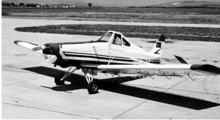
1978'de İmal Edilen, Türk Tasarımı "Mavi Işık"

Türkiye Cumhuriyeti kurulduktan kısa süre sonra havacılık alanında bir çok girişim yapılmıştır. Özel girişimciler için de uygun ortam sağlanmıştır. Ne var ki, bir ülkede uçak üretimi için öncelikle kesintisiz bir devlet desteği önemliydi. Devlet desteği yanında ülkenin içinde bulunduğu ekonomik durum, sanayi altyapısı, diğer ülkelerle olan iletişim ve teknoloji transferi, üretimin sermayeye dönüştürülmesi, uluslararası sertifikasyon, dünyadaki konjonktür, uluslararası ilişkiler, devlet kurumları arasındaki ahenk ve koordinasyon ile tedarik usulleri, personel yönetimi, donanımlı iş gücünün varlığı ve üniversite desteği gibi bir çok hususun var olması gerekir. Tayyare ve Motor Türk Anonim Şirketi kurulduğu yıllarda burada belirtilen hususlar ne derecede mevcuttu. Bunların varlığı ile fabrikanın ayakta kalması doğru orantılı olmuştur.