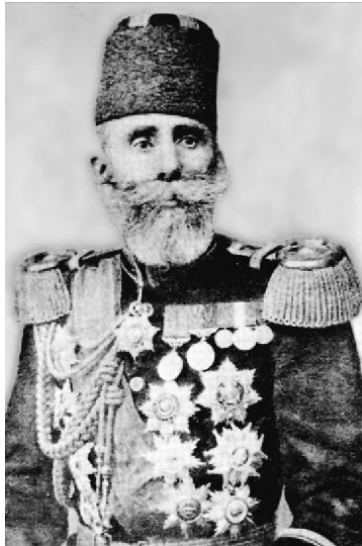
Mahmut Şevket Paşa

Osmanlı Devleti, 19'uncu yüzyıldan itibaren devlet yapısında birçok değişimi başarmış, Batı ile ilişkilerini geliştirmiş, eğitimi sistemini kısmen yenilemiş ve teknik gelişmelere karşı arayış içinde olmuştur. Ne var ki, 1815 Paris Mutabakatı ile şekillenen 19'uncu yüzyıl dünyası, 1870'lerden sonra yeni bir arayış içine girmiş bulunuyordu. 19'uncu yüzyılın ikinci yarısında siyasal bir güç olarak varlığını kabul ettiren Almanya ve İtalya mevcut yapının dışında meydana gelen önemli gelişmelerdi. Osmanlı Devleti'nin zayıflaması ve üzerinde emelleri bulunan devletlerin çalışmaları, Osmanlı coğrafyasında yeni sıkıntılara neden olmuştur. 1293 Osmanlı-Rus Harbi ile Osmanlı Devleti önemli miktarda toprağını kaybetmiş ve Osmanlı toprakları üzerinde yeni devletlerin kurulmasını kabullenmek zorunda kalmıştır. Yunanistan, Sırbistan, Romanya bu gelişmeler sonunda kurulmuş devletlerdir. Dünyanın hızla silahlanması, seri üretimin artması ve yeni pazar arayışları büyük bir kaosun işaretleri olmuştur.