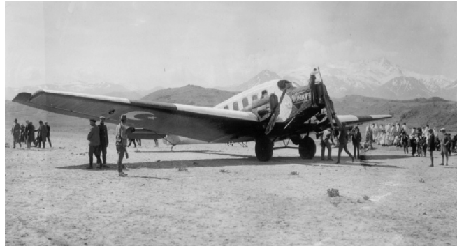
Açılış Törenine Katılımcıları Taşıyan Junkers G-23

TOMTAŞ'ın resmi açılışı 6 Ekim 1926'da icra edilen devlet töreni ile yapılmış ve törene devletin zirvesinden yoğun bir katılım olmuştur. Heyet Ankara'dan Kayseri'ye uçakla gitmiştir. Mustafa Kemal Paşa çok önem verdiği bu tesisin açılışına katılmamış ancak daha sonra Kayseri'ye yaptığı ziyaretlerde tesisleri ziyaret etmiştir. Fabrikanın açılışında; TOMTAŞ İdare Reisi Konya Vekili Refik Bey, Milli Savunma Bakanı Recep Bey birer konuşma yaparak bu büyük girişimin önemine değinmişlerdir 21 . 50 Türk, 120 Alman personel ile fabrika çalışmaya başlamıştır. Burada istihdam edilen Türk personelden bir kısmı gruplar halinde Almanya'ya gönderilerek eğitim almışlardır 22 . Bu dönemin en önemli sorunu yetişmiş personel sıkıntısıydı. Eğitim ile bu sorunun çözülmesi için çalışılmıştır.