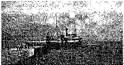
Bu kante, saatlik olarak çalıştırılan yeni makine...