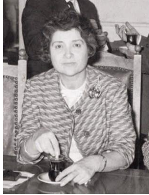
( Leman Cevad Tomsu)

Türkiye'nin ilk kadın mimarı, üstelik Kayserili kadın mimarı hazırladığı projeleriyle girdiği yarışmalarda çeşitli dereceler elde eder. 5 birincilik, 1 ikincilik, 2 üçüncülük ve 6 mansiyon kazanması onun alanında en iyilerden biri olduğunu göstermesi bakımından önemlidir. İstanbul Teknik Üniversitesi'nde 1960 yılına kadar bilimsel çalışmalar yapar ve aynı üniversitede profesör unvanını alır. Leman Cevad Tomsu, meslek hayatı süresince yirmiye yakın projeye imzasını atar. Onu bilinen eserleri arasında Kayseri Halkevi binası da bulunur. 1975 yılında emekliye ayrılır. 29 Nisan 1988 yılında hayata gözlerini yumar. ( Sivacı, 2010: 292)