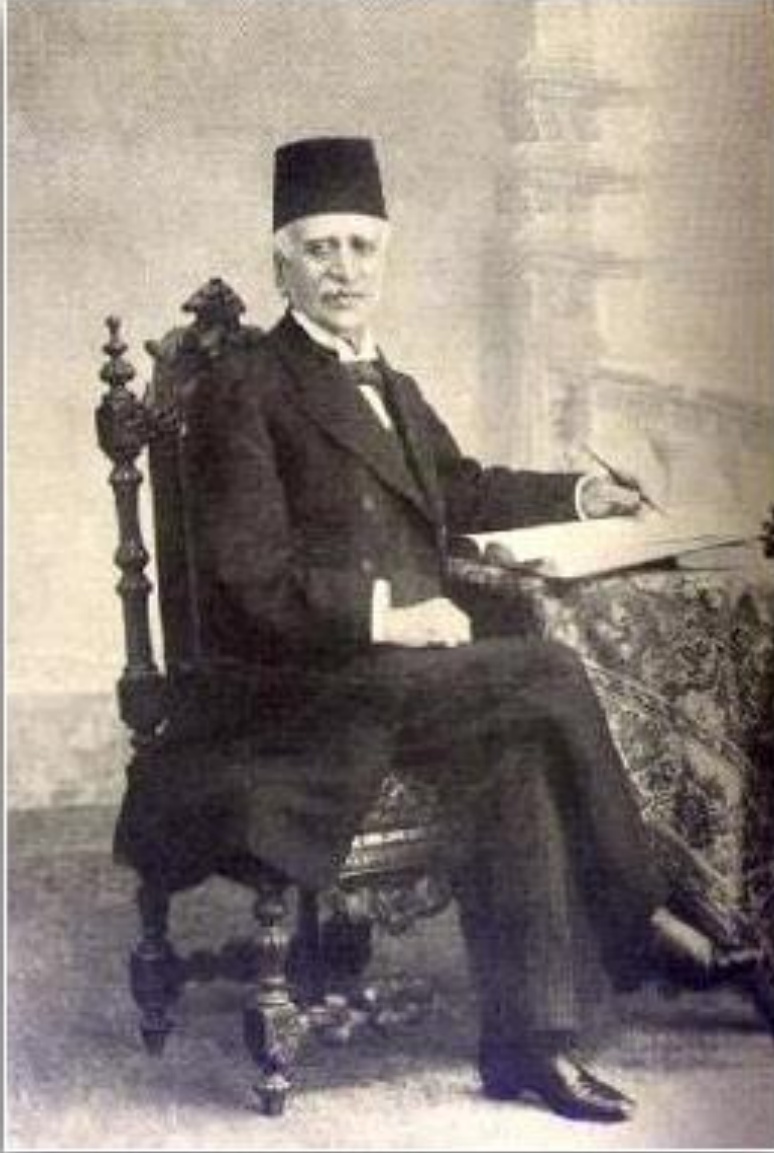
MIRZA MALKAM KHAN

( https://www.wikipedia.org/Mirza_Malkam_Khan )