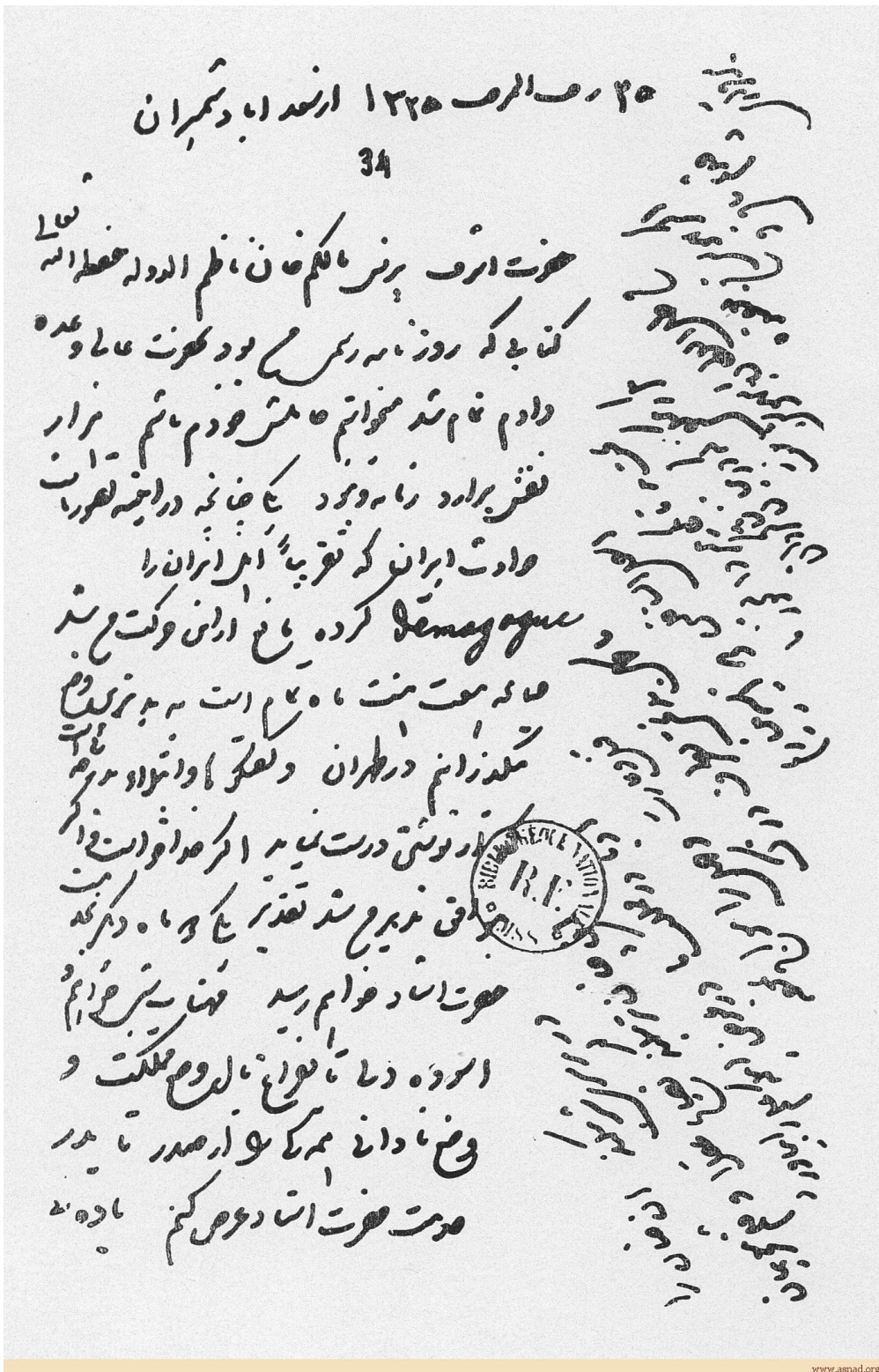
Zill'ul-Sultan'ın Mirza Malkum Han'a İran'daki son gelişmeler ile ilgili bilgiler içeren 25 Recep 1325 (1907) tarihli mektubu. ( http://www.asnad.org/en/document/341/ )