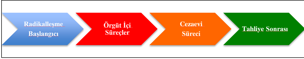
Şekil-2 Radikalleşmeden Dönüş ve Terörist Rehabilitasyonu Süreci