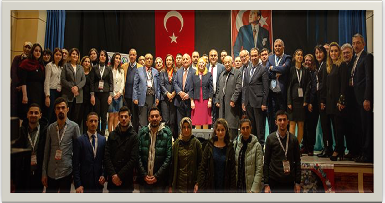
Dozens of valuable scientists, researchers and students took part in the symposiums.