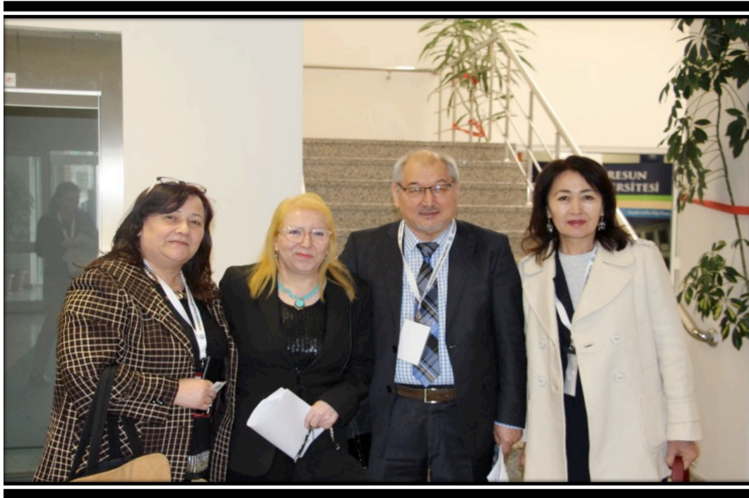
A number of scientists from the Turkish World attended the symposiums for four years.