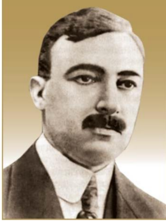
Resim 2. Behbud Han Cevanşir