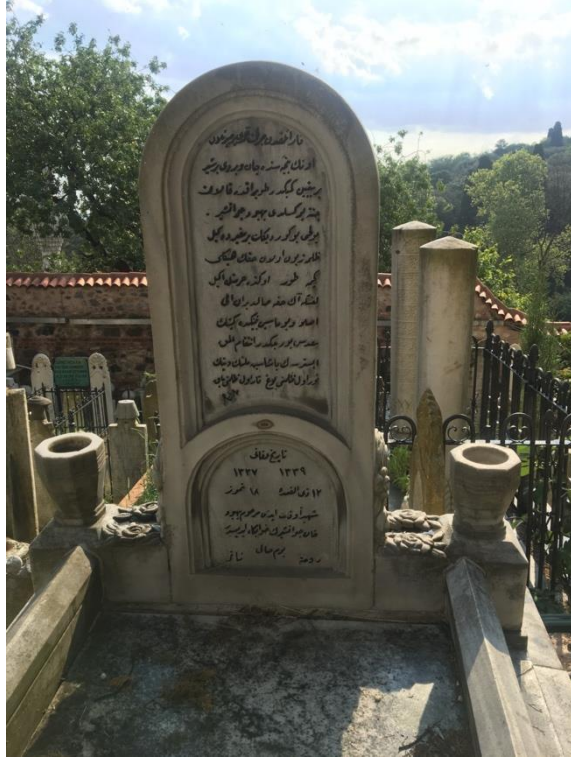
Resim 1. Behbud Han Cevanşir'in Mezarı