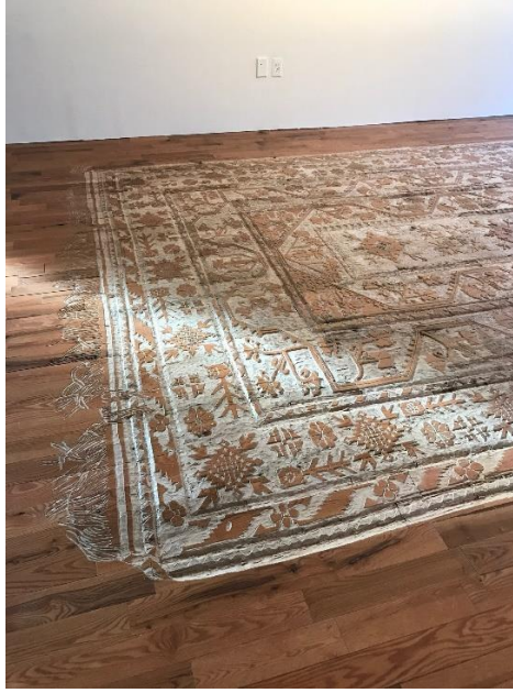
Şekil 2- Selva Aparicio, 'Childhood Memory', 2017

https://www.selvaaparicio.com/work/childhood-memories