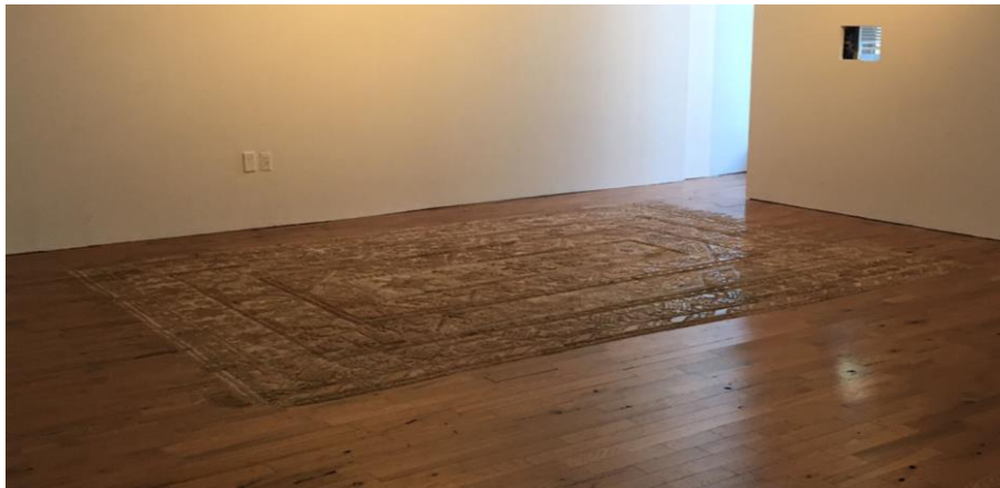
Şekil 1- Selva Aparicio, 'Childhood Memory', 2017

https://www.selvaapario.com/work/childhood-memories