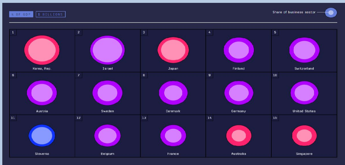
Figure 3: Ratio of R&D Expenditure to GDP Top 15 countries.

expenditures are given as the ratio of GDP. Turkey's annual R & D expenditure as purchasing power parity was $ 15,933 million. The percentage of GDP of R&D expenditures was 0.9%. The number of researchers per million people was 1160. The ratio of male researchers was 63% and female researchers 37%.