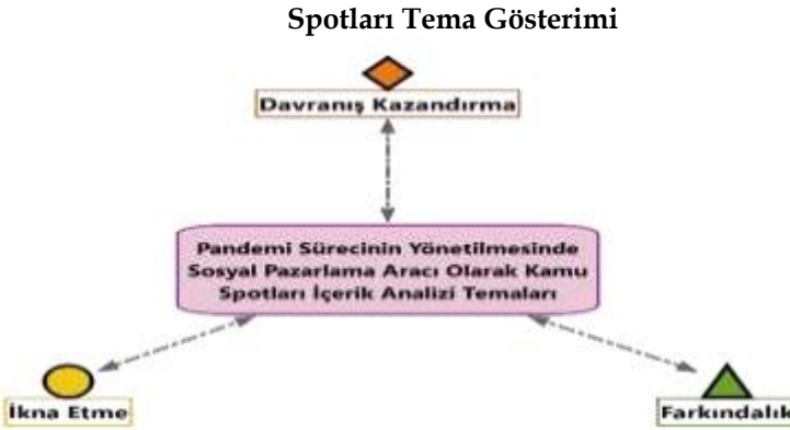
Şekil 1: Pandemi Sürecinin Yönetilmesinde Sosyal Pazarlama Aracı Olarak Kamu

Salgınla mücadelede kamu spotları üzerine yapılan başka bir çalışmada Yeşilyurt (2021) kamu spotlarıyla verilmek istenen mesajları 3 ana tema altında toplayarak kamu spotlarının içerik analizini gerçekleştirmiştir.