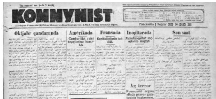
Şekil 2. Komünist Gazetesi, 1 Kasım, 1928. (Kommunist, 1928/11/01/N255, Akt. Karataş, 2018)