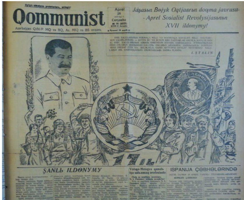
Şekil 1. Komünist Gazetesi, 28 Nisan 1930 (URL-1)