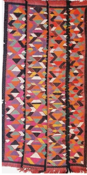
Resim 2. Milli Azerbaycan Tarihi Müzesi Etnoqrafi Fondu env. 5243. Üzeri çalma cicim.Yardımlı. XX yy.

isimli cicim çeşidi de bulunmaktadır. Bu cicim Yardımlı bölgesinde XIX. yüzyılın sonlarında dokunmuştur. Yatay dokuma tezgâhında yapılmış bu cicim dört parçanın birbirine dikilerek birleştirilmesiyle hazırlanmıştır. Cicim çalma adıyla daha çok Orta Anadolu bölgesinde yapılırdı. B. Deniz çalma ismini şöyle izah eder: Cicim hazırlanan zaman arka oturan kişi deseni meydana getiren renkli ipleri desenin durumuna göre iki veya üç çözüğü üzerine sarıp öndeki dokucuya verir. Halk arasında bu işleme çalma veya çelme denir [5, s. 60].