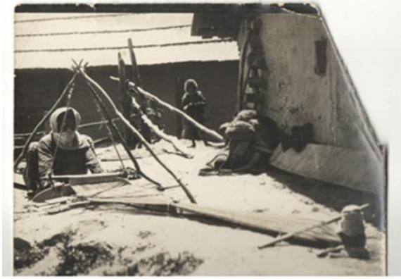
Resim 3. Milli Azerbaycan Tarihi Müzesi Senedli Menbeler Fondu env. 500-69. Cicim dokuyan kadınlar.