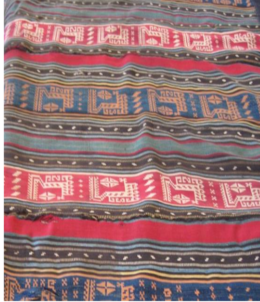
Resim 1. Milli Azerbaycan Tarihi Müzesi Etnoqrafi Fondu env. 8666. Yorqan yüzü. Cicim dokunuşlu. XX yy.

Tarih boyunca Türk halkları çeşitli el sanatlarıyla iştiğal etmiş ve birbirinden güzel sanat eserleri ortaya çıkartarak nesilden-nesle aktarmışlardı. Bu sanat örneklerinin birçoğu bugün dünya müzelerini süslemektedir. Türk halklarında en yaygın sanat dallarından biri de dokumacılık olmuştur. Dokumacılığın çeşitli dalları (havlı, havsız, kumaş vs.) ile uğraşan Türk halkları arasında havsız, kirkitli dokuma olan cicimcilik de yaygın olmuştur. Bilindiği gibi kirkitli dokumalar Türk halkları arasında oldukça geniş kullanım alanına sahip olmuştur. Çeşitli sebeplerden dolayı bu sanat zamanla kullanımdan kalkmıştır. Azerbaycan'da vaktiyle çok ünlü olan cicim mamulleri şimdi yalnız müzelerde sergileniyor.