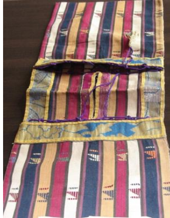
Resim 4. Milli Azerbaycan Tarihi Müzesi Etnoqrafi Fondu env. 7543. Cicim dokunuşlu heybe. Şamahı. XX yy.