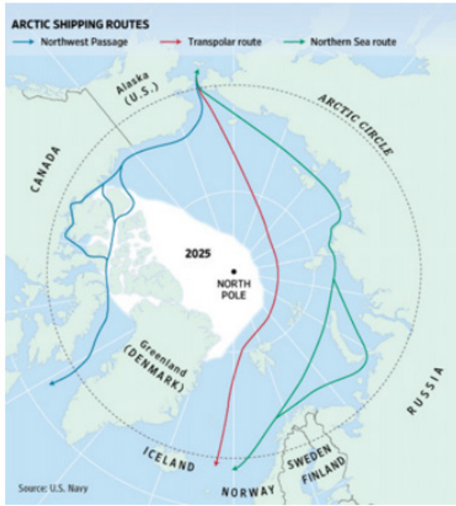
Şekil 1- Arktik bölge deniz ulaşım hatları 21

Konseyin statüsünün gelecekte ne olacağı konusunda iki önemli husus ortaya çıkmaktadır. Bunlardan birincisi konseyin diğer üyelerinin özellikle de Amerika Birleşik Devletleri'nin Rusya'nın eşit koşullarda yer aldığı tam kapsamlı hükümetlerarası bir kuruluşla rıza göstermesini beklemenin gerçekçi bir yaklaşım olarak kabul görmemesidir. Diğer husus ise Arktik Konseyin mevcut gayri resmi ve esnek yapısının, Birleşmiş Milletler ve Avrupa Güvenlik ve İşbirliği Teşkilatı (AGİT) gibi resmi kuruluşların katı ve kuralcı yapıları ile usulleri ile kıyaslandığında daha etkili ve tercih edilir olmasıdır. 20