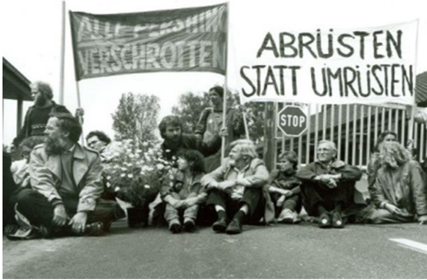
Şekil: Almanya’da yapılan silahsızlandırma protestoları. 8

Yeşiller hareketinde, fabrikaların-nükleer santrallerin kurulması ile birlikte, yeni tehlikelerin getirdiği çevresel risklere odaklanılmıştır. Bu bağlamda Yeşillerin amacı, çevre sorununu ortaya çıkaran nükleer santrallerin kaldırılması, insanın doğa ile uyum içinde yaşayabilmesi, yenilenebilir enerjinin kullanılması, barış hareketi, çevreyi korumak için kamuoyu oluşturmak, çevreye dair toplumsal bilinç oluşturmak, silahsızlanma, kömür salınımının azaltılması, mülteci-göçmen- işçi haklarının korunması ve her türlü şiddeti (Kadına, çocuğa, hayvana, doğaya karşı şiddeti) önlemektir. Özgür, eşitlikçi bir toplum hayal eder. Bu anlamda Yeşiller hareketinin temel ilkeleri, ekoloji, taban demokrasisi, barış hareketi, sosyal politika ve ekonomi politikadır. (Necef, 1988). Ekoloji ilkesinde atom enerjisine, ormanların öldürülmesine, suların kirletilmesine, nükleer tehlikelere yani doğaya zarar verebilecek her türlü davranışa karşıdır. Bu anlamda Beck’e göre “İnsanın doğanın bir parçası olduğunu ve bu uyumu bozmaya çalıştığımızda tüm doğanın, dolayısıyla da insanın sonunu hazırlamış olacağı savunulmaktadır.” (2019: 31). Nükleer enerjiler de risk üretir. Yüzde yüz bir güvenlik teminatı yoktur. Bu bakımdan Beck ‘in ifade ettiği gibi bir risk toplumu kuramını okuyabiliriz.