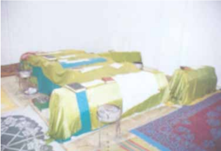
Çok Makamlı Hızır Türbesi