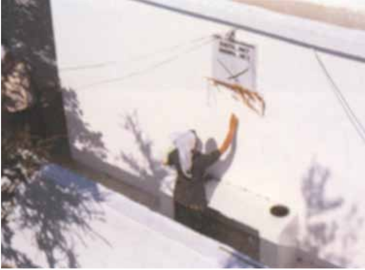
Taş veya Para Yapıştırmak