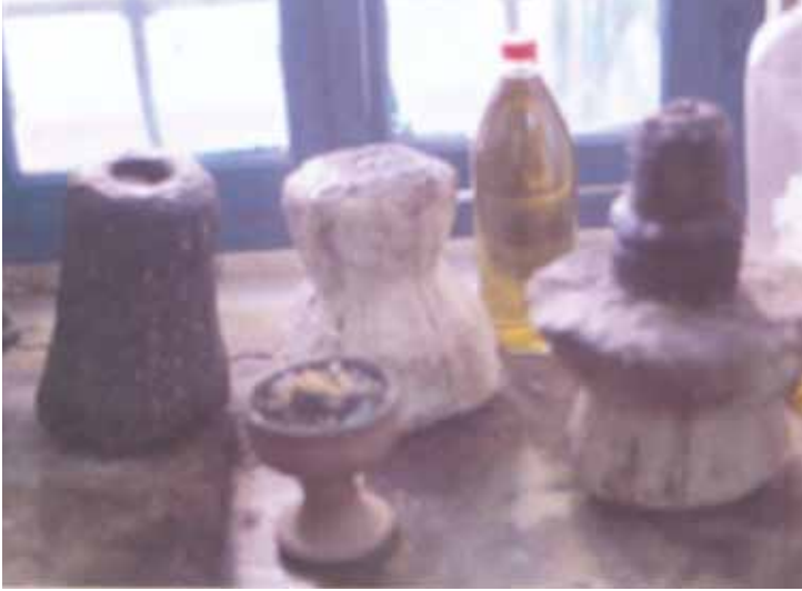
Şifalı Olduğuna İnanılan Zeytinyağı