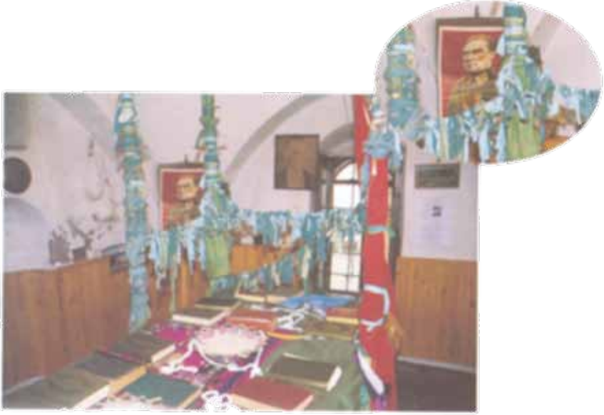
Hızır Türbesinde Atatürk Resmi