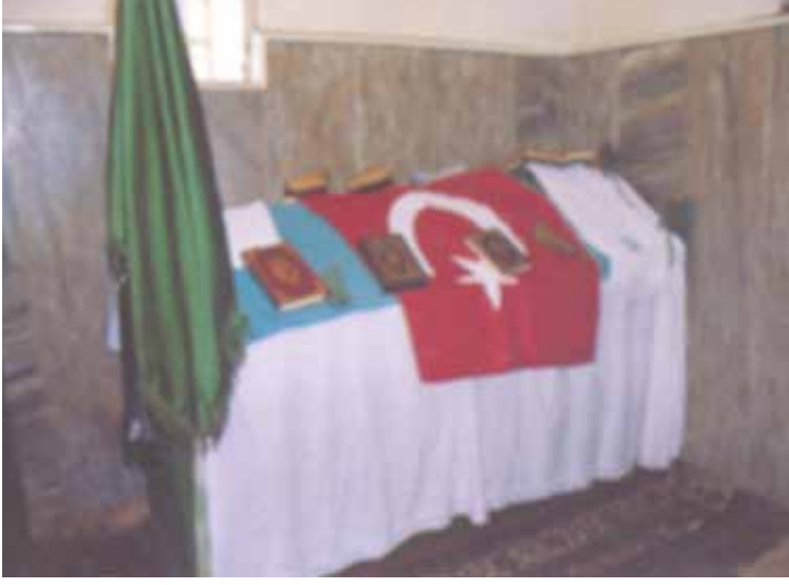
Tek Makamlı Hızır Türbesi