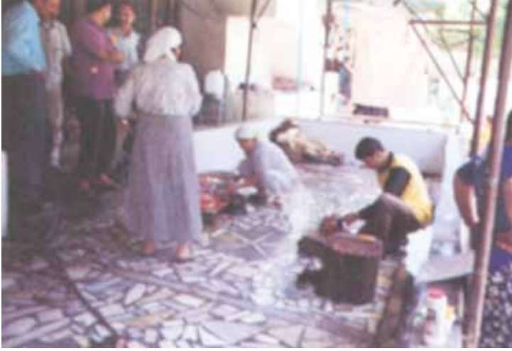
Adak Kurbanı: Yemek Hazırlayan Kadınlar