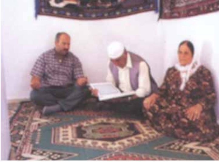
Türbede Kuran Okuyanlar (H.Türk Arşivi)