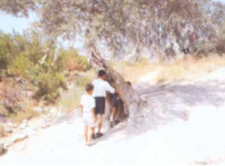
Şifa Bulmak İçin Dilek Ağacının Deliğinden Geçen Çocuklar