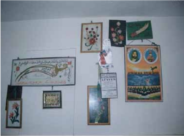
Kız Elişleri (Zeynel Abidin Makamı/Armutlu