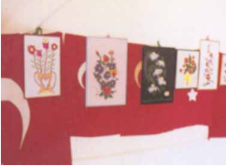
Türbede Bulunan Kız Elişleri