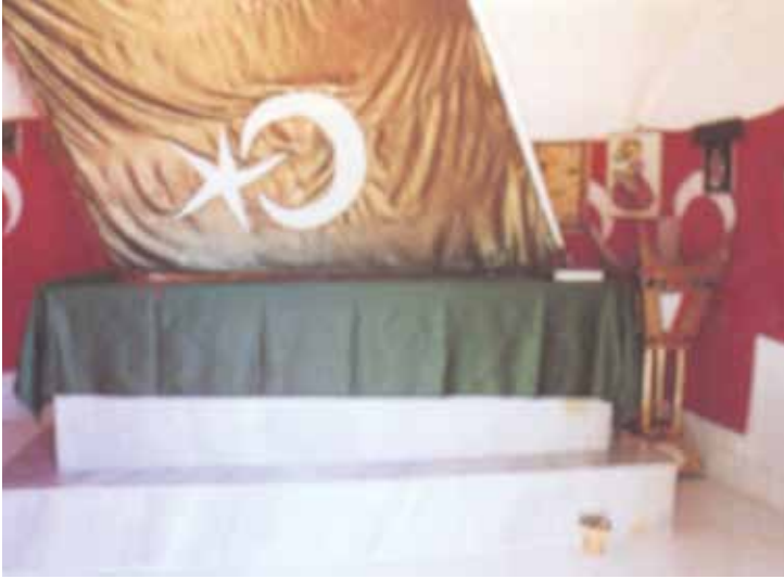
Hızır Türbesinde Yeşil Bayrak