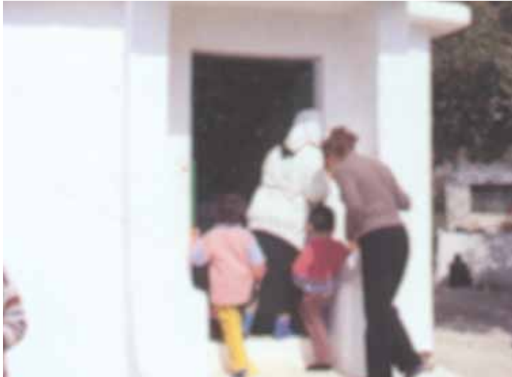
Kapının Öpülmesi