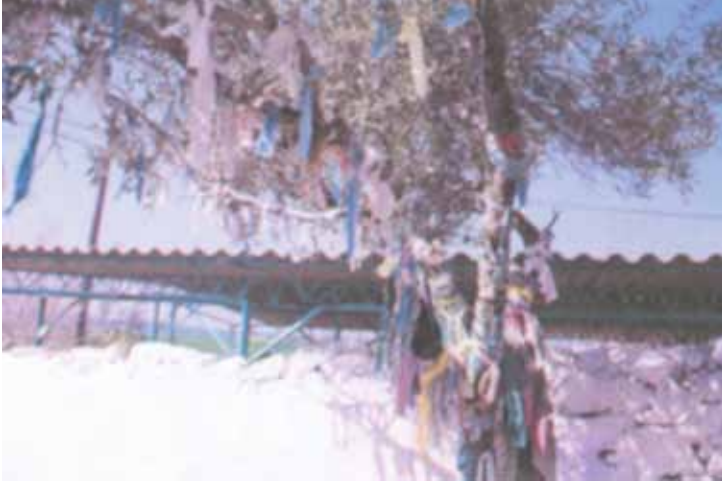
Dilek Ağacı