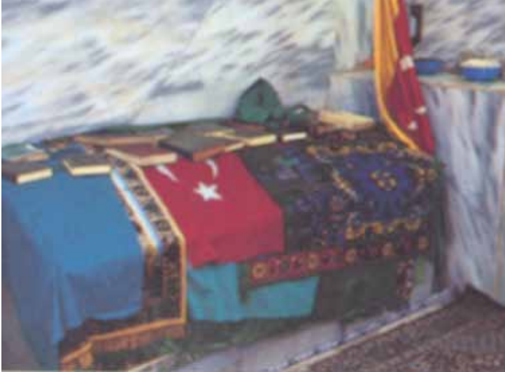
Hızır Türbesinde Türk Bayrağı