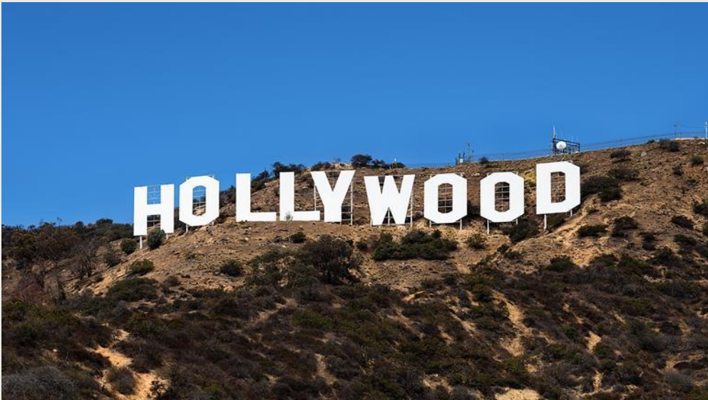
Şekil 1: Los Angeles, Kalforniya’da bulunan Amerikan kültür simgesi

İktisadi ve teknolojik üstünlüğü sayesinde ABD, Hollywood sinemasına tanıtım için önemli yatırımlar yapmıştır. 6 ABD’nde toplumun sinemaya verdiği önem ve kullanılan yenilikçi teknolojiler, Hollywood sinemasını bir endüstri haline dönüştürmüştü. Küresel ölçekte izlenen ve dünya sinemasının bazı kısa dönemler hariç rekabet edemediği Hollywood sineması, ABD imajını güçlendiren bir araç niteliğindedir (Robb, 2002: 23 – 25).