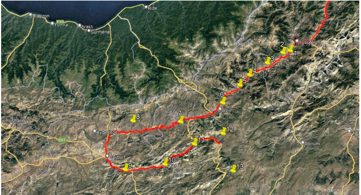
Şekil.1. Arılıkların coğrafik konumları