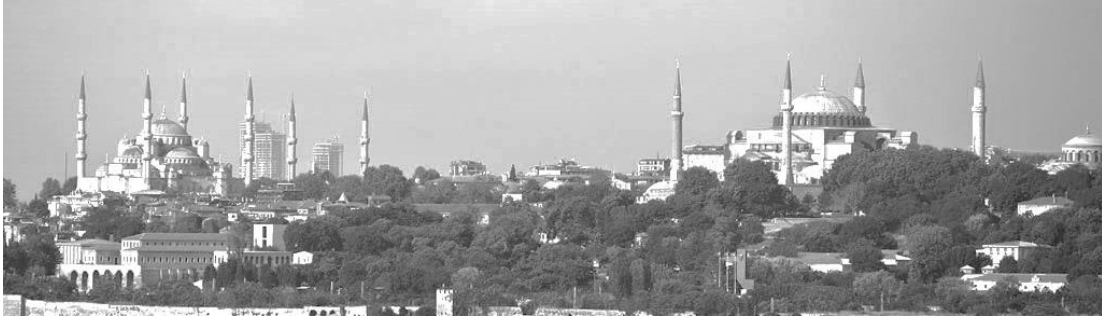
Figure 1. Istanbul's historical skyline and Zeytinburnu 16/9 Towers